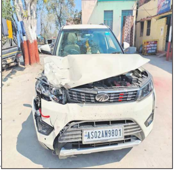
महिला के शव को कब्जे में लेकर पोस्टमार्टम के लिए भेज दिया। वहीं घटना को अंजाम देकर वाहन भागने में सफल रहा। पुलिस वाहन की तलाश कर रही है।