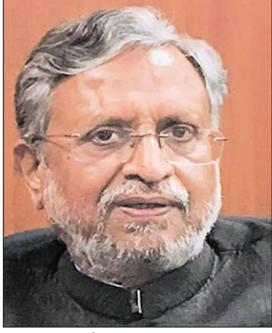
कर एनडीए के साथ आ गए

नवबिहार टाइम्स ब्यूरो पटना। पूर्व उपमुख्यमंत्री सुशील कुमार मोदी ने कहा कि जिस समय कांग्रेस और राजद के राजकुमार परिवार बचाओ यात्राओं की नौटंकी कर रहे हैं, उसी समय इन दोनों दलों में टूटने की प्रक्रिया तेज हो गई। अब यह कहना कठिन है कि संसदीय चुनाव तक इन दलों में कौन टिका रहेगा। श्री मोदी ने कहा कि बिहार विधानसभा के इसी सत्र में दो सप्ताह के भीतर राजद कांग्रेस के 7 विधायक महागठबंधन छोड़