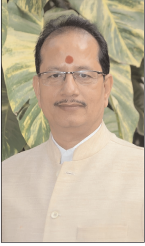
स्वीकृत प्रदान की गई है, जिससे अधिक से अधिक किसानों को सिंचाई सुविधा का लाभ मिल सके। उप मुख्यमंत्री ने कहा कि इस

योजना का मुख्य उद्देश्य लघु एवं सीमांत किसानों को सिंचाई के आधुनिक साधनों से जोड़ना है, ताकि खेती में पानी की बचत, उत्पादकता में वृद्धि और लागत में कमी सुनिश्चित की जा सके। यह पहल राज्य में लाभकारी और टिकाऊ कृषि को बढ़ावा देने की दिशा में एक महत्वपूर्ण कदम है। योजना के अंतर्गत ड्रिप सिंचाई प्रणाली को अपनाने पर लघु एवं सीमांत किसानों को कुल लागत पर 80 प्रतिशत तथा अन्य किसानों को 70 प्रतिशत तक अनुदान उपलब्ध कराया जाएगा। वहीं पोटेबल सिंचकलर सिंचाई प्रणाली के लिए लघु एवं सीमांत किसानों को 55 प्रतिशत तथा अन्य किसानों को 45 प्रतिशत अनुदान का प्रावधान किया