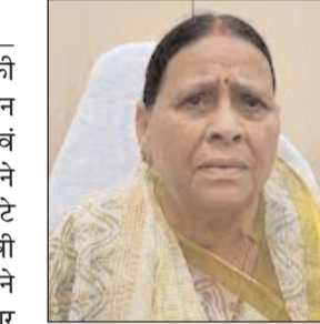
कि हत्या, अपहरण और बलात्कार की घटनाएं लगातार बढ़ रही हैं और अब सरकार नीतीश से संभल नहीं रही। उन्होंने कहा कि महिलाएं सुरक्षित नहीं हैं, व्यापारी डरे हुए हैं और युवाओं को रोजगार नहीं मिल रहा। नीतीश कुमार की सरकार पूरी तरह से फेल हो गई