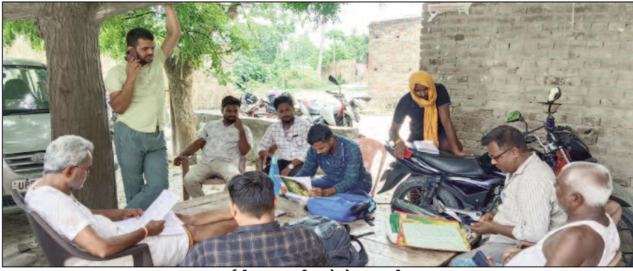
हुए 2011 अधिनियम, 2012 नियमावली तथा 2017 व 2019 के संशोधन के तहत आधुनिक प्रक्रिया से मानचित्र व खतियान तैयार किया जा रहा है।