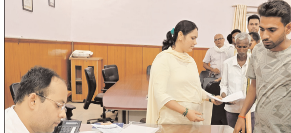
अर्जन से जुड़ी शिकायतों, स्वास्थ्य व्यवस्था की खामियों और अन्य जनसमस्याओं को लेकर बड़ी संख्या में लोग पहुंचे। कई आवेदकों ने भूमि कब्जा मुक्त कराने की गुहार लगाई जिस पर जिला पदाधिकारी ने संबंधित अंलाधिकारी और थाना प्रभारी

गया। जिला समाहरणालय गया में सोमवार को आयोजित दैनिक जनता दरबार में जिला पदाधिकारी शशांक शुभकर ने 100 से अधिक आवेदकों की समस्याओं की सुनवाई की। उन्होंने संबंधित विभागों के अधिकारियों को त्वरित कार्रवाई के निर्देश देते हुए कहा कि जनता दरबार आम जनता की सरकार तक सीधी पहुंच का माध्यम है जिसका उद्देश्य पारदर्शी और संवेदनशील प्रशासन के जरिए जनसमस्याओं का शीघ्र समाधान करना है। जनता दरबार में भूमि विवाद, कब्जा मुक्त कराने, जन वितरण प्रणाली में गड़बड़ी, भू-