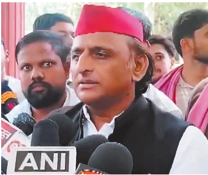
प्रशिक्षण केंद्र के रूप में भी देखा जा रहा है, जहां युवाओं को समाजवादी विचारधारा से जोड़ा जाएगा।

आजमगढ़ में समाजवादी पार्टी का यह नया कार्यालय 2027 के विधानसभा चुनावों को ध्यान में रखकर बनाया गया है। अखिलेश ने इसे पीडीएम भवन नाम देकर अपनी रणनीति को स्पष्ट कर दिया। पीडीएम, यानी पिछड़ा, दलित, और अल्पसंख्यक सपा की राजनीतिक रणनीति का आधार रहा है, जिसने 2024 के लोकसभा चुनावों में पार्टी को 37 सीटें दिलाकर उत्तर प्रदेश में बीजेपी के विजय रथ को रोकने में मदद की। अखिलेश ने उद्घाटन समारोह में कहा, 'पीडीएम की एकता ही हमें 2027 में सत्ता दिलाएगी।' इस भवन को न केवल एक कार्यालय, बल्कि एक