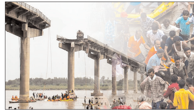
गुजरात में महिसागर नदी पर बना पुल ढहा

* मूल्य : 3.00 रुपये * औरंगाबाद एवं बोकारो से प्रकाशित * www.navbihartime.com