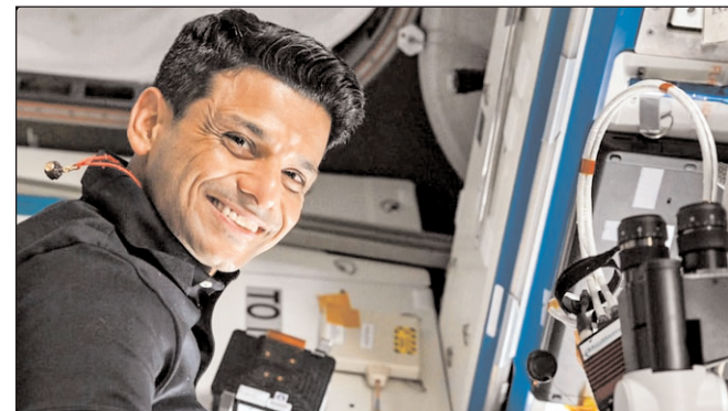
आईएसएस में भारतीय अंतरिक्ष यात्री शुभांशु शुकला