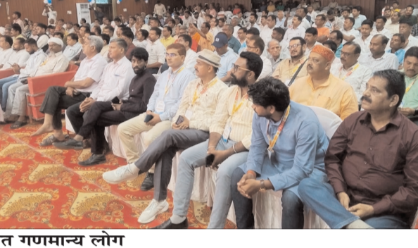
समारोह में उपस्थित गणमान्य लोग