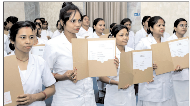
पटना में नवनियुक्त एएनएम को मिला नियुक्ति पत्र

* मूल्य : 3.00 रुपये * औरंगाबाद एवं बोकारो से प्रकाशित * www.navbihartime.com