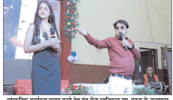
सांस्कृतिक कार्यक्रम प्रस्तुत करते देव एंड फ्रेंड यूजिकल ग्रुप, पटना के कलाकार