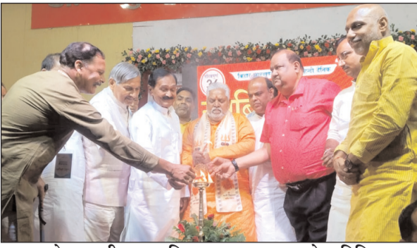
समारोह का दीप प्रज्वलित कर उद्घाटन करते अतिथिगण