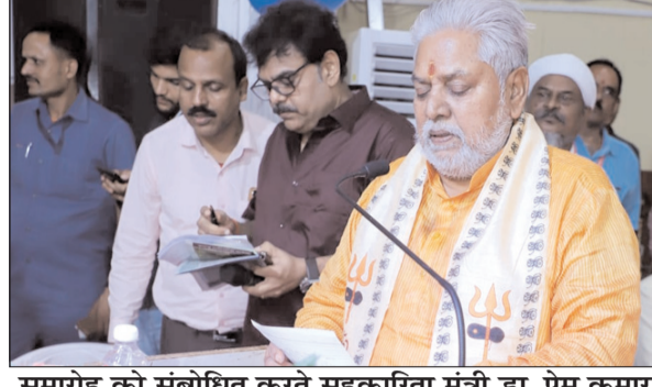
समारोह को संबोधित करते सहकारिता मंत्री डा. प्रेम कुमार