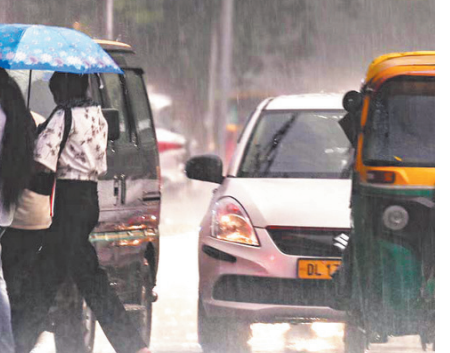
पड़ा। हालांकि, कुछ ही देर में बादलों ने आकर सूरज को ढक लिया। दिल्ली के कई इलाकों में दिन के समय हल्की से मध्यम बारिश दर्ज की गई। पूरा क्षेत्र में सबसे ज्यादा 34.5 मिमी बारिश रिकॉर्ड की गई। नजफगढ़ क्षेत्र में 16 मिमी और जनकपुरी में 15.5 मिमी बारिश दर्ज की गई। बादल छाए रहने और कई इलाकों में हुई बारिश के चलते अधिकतम तापमान में गिरावट दर्ज की गई। दिल्ली की मानक वेधशाला सफदरजंग में दिन का अधिकतम तापमान 36.2 डिग्री सेल्सियस रिकॉर्ड किया गया जो सामान्य से 1.2 डिग्री सेल्सियस कम

मौसम विभाग का अनुमान है कि अगले दो दिनों के बीच दिल्ली में बादलों की मौजूदगी बनी रहेगी। इस बीच में हल्की से मध्यम बारिश के आसार हैं। अधिकतम तापमान 35 से 37 डिग्री सेल्सियस तक रह सकता है। मौसम विभाग ने शनिवार और रविवार के लिए येलो अलर्ट जारी किया है। दिल्ली के ज्यादातर हिस्सों में शुक्रवार सुबह से ही हल्के बादलों की मौजूदगी बनी रही। बीच-बीच में जब तेज धूप निकली तो लोगों को गर्मी और उमस का सामना करना