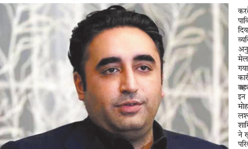
द्वारा वैश्विक आतंकवादी घोषित किया गया था। भारत की मुख्य चिंता यह है कि पाकिस्तान बार-बार यह दावा करता है कि उसके पास अजहर की कोई जानकारी नहीं है, जबकि जैश-ए-मोहम्मद के कार्यालय मदरसे और ठिकाने पाकिस्तान में खुलेआम चल रहे हैं। बिलावल भुट्टो अपने बयानों से पाकिस्तान को एक बेचारा देश साबित करने की कोशिश

पहले अफगान जिहाद में सक्रिय था और अब तालिबान की सत्ता में वापसी के बाद वहां उसकी गतिविधियों की संभावना अधिक है। भुट्टो का यह बयान ऐसे समय पर आया है जब भारत ने ऑपरेशन सिंदूर के तहत पाकिस्तान और ब्रह्मच में आतंकी शिविरों को निशाना बनाया था। यह सैन्य कार्रवाई 22 अप्रैल को पहलगाम में हुए आतंकी हमले के जवाब में की गई थी, जिसमें 26 नागरिकों की मौत हो गई थी। भारत लगातार यह दावा करता रहा है कि मसूद अजहर अफगानिस्तान के बहावलपुर में स्थित है और वहीं से जैश-ए-मोहम्मद की गतिविधियों का संचालन करता है। भारत के अनुसार मौलाना मसूद अजहर 2016 के संसद हमले, 26/11 मुंबई हमले, 2001 के पठानकोट एयरबेस हमले और 2019 के पुलवामा आत्मघाती हमलों का मास्टरमाइंड है। मसूद अजहर को 2019 में संयुक्त राष्ट्र