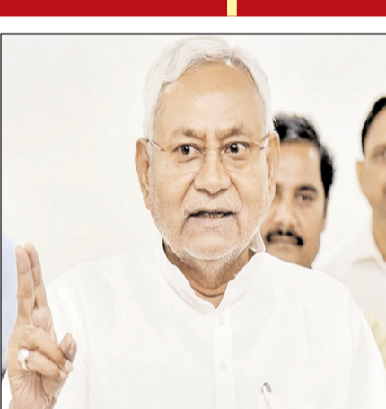
और पुलिस कर्मियों पर कड़ी कार्रवाई करने की चेतावनी दी। मुख्यमंत्री ने कहा कि अपराध के कारणों