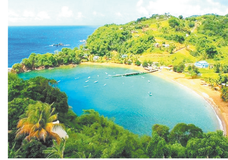
लिए मशहूर है। इस कैरेबियाई देश में बड़ी संख्या में भारतीय प्रवासी समुदाय है, जिनकी जड़ें 180 साल पुरानी हैं। यहां के बहुत से नागरिकों के पूर्वज 19वीं सदी में गिरमिटिया मजदूर के रूप में भारत से आए थे। आज वे देश के सामाजिक, राजनीतिक और सांस्कृतिक जीवन में अहम भूमिका निभा रहे हैं। प्रधानमंत्री नरेंद्र मोदी ने हाल ही में त्रिनिदाद की यात्रा के दौरान इन संबंधों को साझा संस्कृति और भविष्य की साझेदारी बताया। इस दौरान भारत और त्रिनिदाद के बीच कई समझौते भी हुए।

चगवानस एजेंसी। दुनियाभर में भारतीय पासपोर्ट की ताकत लगातार बढ़ती जा रही है। अब भारतीय नागरिक त्रिनिदाद एंड टोबैगो जैसे खूबसूरत और सांस्कृतिक रूप से समृद्ध देश में बिना वीजा 90 दिन तक रह सकते हैं। यह सुविधा सिर्फ पर्यटन ही नहीं, बल्कि परिवार से मिलने या व्यावसायिक उद्देश्य के लिए यात्रा कर रहे भारतीयों पर भी लागू होती है। यह सुविधा दशांती है कि भारत और त्रिनिदाद एंड टोबैगो के संबंध कितने मजबूत हैं, और यह भी दिलचस्प है कि इस देश की सत्ता के प्रमुख पदों पर भारतीय मूल के नेता मौजूद हैं। बिना वीजा के 90 दिन कैसे बिता सकते हैं? जाते नियम भारतीय नागरिक यदि घूमने, बिजनेस या परिवार से मिलने के लिए त्रिनिदाद एंड टोबैगो जाना चाहते हैं, तो उन्हें पहले से वीजा लेने की जरूरत नहीं है। वे वहां 90 दिनों तक रुक सकते हैं। हालांकि कुछ बुनियादी नियमों का पालन करना जरूरी है- त्रिनिदाद एंड टोबैगो दो द्वीपों से मिलकर बना एक कैरेबियाई देश है, जो अपनी प्राकृतिक सुंदरता, संस्कृति और विविधता के