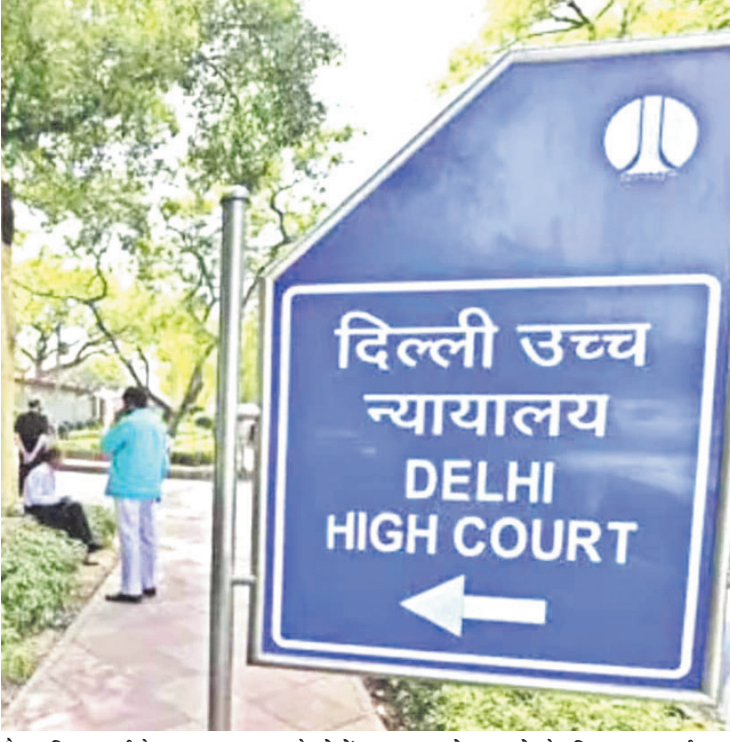
हाईकोर्ट ने डीजेबी को फटकार लगाई 'आप लोगों से गंदा पानी पीने की उम्मीद कैसे कर सकते हैं'

बेंच ने बीती 2 जुलाई को दिल्ली जल बोर्ड को संबंधित इलाकों का निरीक्षण करने का आदेश दिया था। जल बोर्ड की तरफ से बेंच को बताया गया कि जांच एजेंसी ने पाया कि योजना विहार क्षेत्र में जलापूर्ति पाइपलाइनें बहुत पुरानी हो गई हैं। उन्हें बदलने की जरूरत है। डीजेबी ने अपने सर्वे के आधार पर एक स्ट्रेस रिपोर्ट दायर की