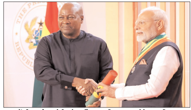
धाना में पीएम नरेन्द्र मोदी को सर्वोच्च नागरिक सम्मान देते राष्ट्रपति महामा

* रजि. नंबर : 52290/90 * वर्ष : 36 * अंक : 38 * पृष्ठ : 12 * औरंगाबाद, शुक्रवार, 4 जुलाई 2025 * मूल्य : 3.00 रुपये * औरंगाबाद एवं बोकारो से प्रकाशित * www.navbihartime.com