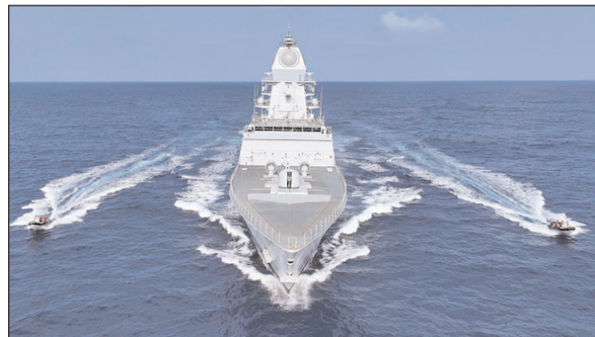
उदयगिरि और आइएनएस तमाल से बड़ी भारतीय नौसेना की ताकत

* मूल्य : 3.00 रुपये * औरंगाबाद एवं बोकारो से प्रकाशित * www.navbihartime.com