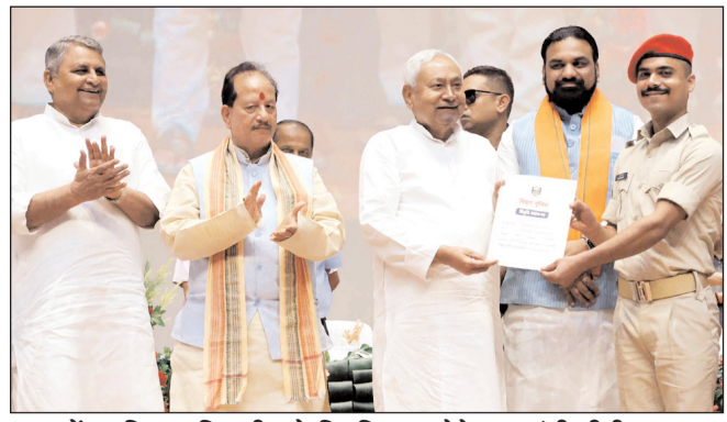
पटना में नवनियुक्त सिपाही को नियुक्ति पत्र देते मुख्यमंत्री नीतीश कुमार

* मूल्य : 3.00 रुपये * औरंगाबाद एवं बोकारो से प्रकाशित * www.navbihartime.com