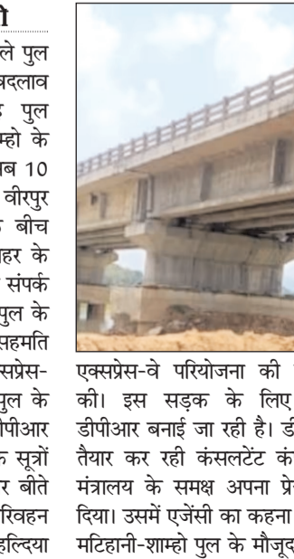
एक्सप्रेस-वे परियोजना की समीक्षा की। इस सड़क के लिए अभी डीपीआर बनाई जा रही है। डीपीआर तैयार कर रही कंसल्टेंट कंपनी में मंत्रालय के समक्ष अपना प्रेजेंटेशन दिया। उसमें एजेसी का कहना था कि मटिहानी-शाम्हो पुल के मौजूदा स्थल

पटना। गंगा नदी पर बनने वाले पुल के मार्ग (एलाइनमेंट) में बदलाव किया गया है। पहले यह पुल बेगूसराय के मटिहानी से शाम्हो के बीच बनना था। लेकिन इसे अब 10 किलोमीटर आगे बेगूसराय के वीरपुर से लखीसराय के कजरा के बीच बनाया जाएगा। लखीसराय शहर के बजाए यह पुल मुंगेर को सीधा संपर्क प्रदान करेगा। केंद्र सरकार ने पुल के इस एलाइनमेंट की सैद्धांतिक सहमति दे दी है। रक्सौल-हल्दिया एक्सप्रेस-वे के तहत बनने वाले इस पुल के आधार पर ही सड़क की डीपीआर बनाई जा रही है। अधिकांश सड़कों से मिली जानकारी के अनुसार बीते दिनों केंद्रीय सड़क एवं परिवहन राजमार्ग मंत्रालय ने रक्सौल-हल्दिया