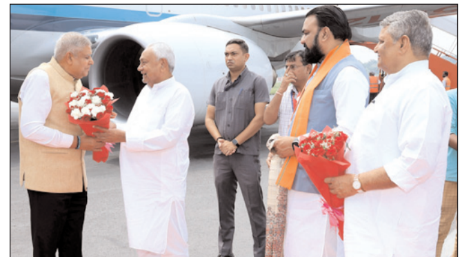
उपराष्ट्रपति जगदीप धनखड़ का पटना एयरपोर्ट पर स्वागत करते मुख्यमंत्री नीतीश कुमार

* मूल्य : 3.00 रुपये * औरंगाबाद एवं बोकारो से प्रकाशित * www.navbihartime.com