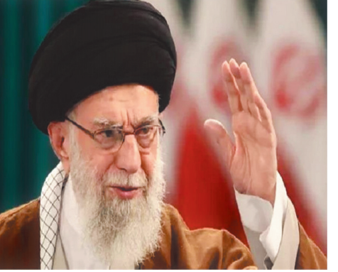
हमले में सेना के प्रमुख अधिकारी और वैज्ञानिक मारे गए: आईआरएनए के मुताबिक, इस हमले में ईरान की सैन्य क्षमताओं को मजबूत करने वाले कई शीर्ष अधिकारी

खामनेई ने लगाया इजराइल पर गंभीर आरोप: अयातुल्ला खामनेई ने इस हमले को अपराध करार दिया और कहा कि इसमें इजराइल के शैतानी और रक्त-रंजित हाथ शामिल हैं। उन्होंने इजराइल की नीयत को उजागर करते हुए कहा कि उसने आवासीय इलाकों पर हमला करके अपनी दुर्भावनापूर्ण प्रकृति साबित कर दी है। उनका यह बयान इस क्षेत्र में बढ़ती तनावपूर्ण स्थिति की गहराई को दर्शाता है।