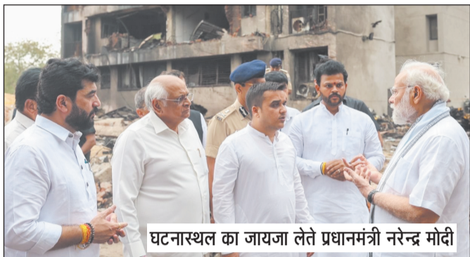
घटनास्थल का जायजा लेते प्रधानमंत्री नरेन्द्र मोदी

नवबिहार टाइम्स ब्यूरो अहमदाबाद/ नई दिल्ली। अहमदाबाद में एअर इंडिया फ्लाइट एआइ-171 हादसे के एक दिन बाद शुक्रवार को एयरक्राफ्ट एक्सीडेंट इन्वेस्टिगेशन ब्यूरो ने ब्लैक बॉक्स को खोज लिया है। यह हॉस्टल की छत पर मिला। इसके जरिए पता चल सकेगा कि क्रैश होने के पहले आखिरी पलों में क्या हुआ था। बता दें कि एअर इंडिया की फ्लाइट में 12 कू मंबर समेत 242 लोग मौजूद थे। इसमें से एक यात्री की जान बच गई। मरने वालों में राजस्थान से 13, एमपी, हरियाणा और बिहार के एक-एक लोग शामिल हैं। उधर, पूर्व सीएम रूपानी के शव की पहचान भी अब तक नहीं हो पाई है। मृतकों की पहचान के लिए उनके परिजन के डीएनए टेस्ट लिए जा रहे हैं। रेक्स्यू टीम ने 270 लोगों के शव बरामद कर लिए हैं। इनमें से 7 की बांडी को