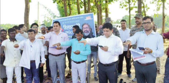
कार्य में प्रगति लाने का निर्देश दिया। उपायुक्त ने कहा कि इनके सर्वांगीण विकास के लिए आवश्यक है कि इन्हें कौशल विकास के तहत जोड़ा जाए। उपायुक्त ने बताया कि नशा करना स्वास्थ्य के लिए हानिकारक है, साथ ही बच्चों पर इसका दुष्परिणाम पड़ता है। उन्होंने नशा से दूर रहते हुए मेहनत कर अपने परिवार का भरण पोषण करने को कहा। उपायुक्त ने जिले भर में चल रहे नशा मुक्ति अभियान को रेखांकित करते हुए उपस्थित सभी लोगों को नशा न