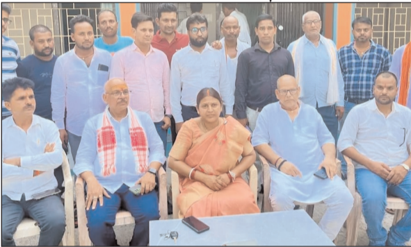
नहीं कर पा रहे हैं वहीं महागठबंधन की राज्य सरकार पर भड़ास निकालते हुए कहा कि यहाँ की सरकार विकास विरोधी है। जिला मुख्यालय से लेकर प्रखंड मुख्यालयों के कर्मी भ्रष्टाचार में लिप्त हैं वहीं स्वास्थ्य विभाग के

व्यवस्था में सुधार नहीं हुआ, तो आंदोलन किया जाएगा। उन्होंने कहा कि बिजली समस्या को लेकर सरकार विकास विरोधी है। जिला मुख्यालय से लेकर प्रखंड मुख्यालयों के कर्मी भ्रष्टाचार में लिप्त हैं वहीं स्वास्थ्य विभाग के