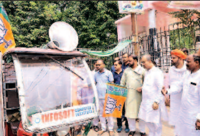
नवबिहार टाइम्स ब्यूरो

महिला मोर्चा ने चलाया जनसंपर्क अभियान, मंत्री मंगल पांडेय ने किया एनडीए रथ को रवाना