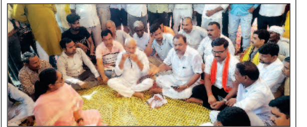
नौतन बिहार टाइम्स ब्यूरो

नागरिक मंच के बैनर तले धरना-प्रदर्शन, सभी दलों के नेता हुए एकजुट; आंदोलन की चेतावनी