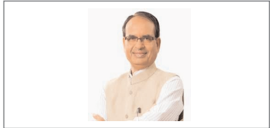
शिवराज सिंह चौहान

भारत एक कृषि प्रधान राष्ट्र है, जहाँ किसान केवल अन्नदाता नहीं, बल्कि देश की अर्थव्यवस्था और सामाजिक संरचना का एक मजबूत स्तंभ है। जब किसान मिट्टी को जोतता है तो वह सिर्फ फसल नहीं, बल्कि देश के करोड़ों नागरिकों के लिए जीवन और समृद्धि का बीज बोता है। कृषि क्षेत्र करोड़ों लोगों को आजीविका देता है। साथ ही, राष्ट्रीय खाद्य सुरक्षा और ग्रामीण विकास का प्रमुख आधार भी है। ऐसे में राष्ट्र की प्रगति के लिए हमारे किसान भाइयों-बहनों की उन्नति आवश्यक है।