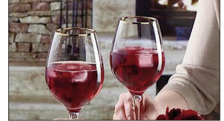
हिसाब से सालाना 57 करोड़ रुपये से अधिक की राशि अधिकारियों और उनके करीबियों की जेब में गई। यह राशि खुदरा दुकानदारों द्वारा शराब के शौकीनों से एमआरपी से अधिक वसूलकर जमा की जाती है। आश्चर्यजनक यह भी है कि घोटाले की जांच और लगातार हो रही कार्रवाई के बावजूद दुकानों में अधिक वसूली रुका नहीं है। अभी भी अधिक वसूली प्रति बोतल की जा रही है। अधिक वसूली का खेल सिर्फ बीयर तक सीमित नहीं है। शराब की प्रति बोतलों की बिक्री में भी भारी वसूली के तथ्य सामने आए हैं। एसीबी के आकलन के मुताबिक, शराब की वार्टर बोतल पर 10 रुपये, हाफ बोतल पर 20 रुपये और पूरी बोतल पर 50 रुपये की अतिरिक्त वसूली की जा रही है। बड़े और ब्रांडेड प्रीमियम ब्रांड की बोतलों पर तो 100 से 150 रुपये तक की अतिरिक्त होती है, यानी कुल 4.80 लाख केन या बोतलें। प्रति केन या बोतल पर 10 रुपये की अतिरिक्त वसूली से हर माह 48 लाख रुपये की अवैध कमाई होती है। इस