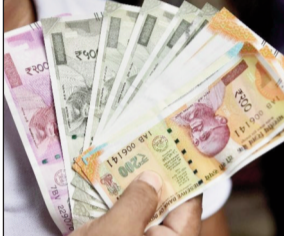
विभाग को राशि उपलब्ध कराती है। लेकिन पेयजल स्वच्छता विभाग को मिली यह राशि टैंकरों की मरम्मत और स्वच्छता के लिए खर्च होगी। राज्य में करीब 35 हजार खराब हैंडपंप की मरम्मत हो चुकी है। बता दें कि पेयजल स्वच्छता विभाग के आंकड़ों के मुताबिक कुल 70 हजार हैंडपंप खराब पड़े थे। वित्त एवं योजना विभाग से राशि मिलने के बाद इनमें से आधे की मरम्मत कर दी गई है। इससे संबंधित रिपोर्ट भी विभाग को जिलों से मिल गई है। बाकी की खराब जल स्रोतों की मरम्मत जून के अंत तक पूरा करने का लक्ष्य रखा गया है।

नवबिहार टाइम्स संवाददाता रांची। बारिश के बाद जमा पानी को स्वच्छ रखने, सफाई वाले वाटर टैंकर की सफाई और मरम्मत के लिए केंद्र सरकार से पेयजल स्वच्छता विभाग को 65 करोड़ की सहायता राशि मिल रही है। जल जमाव होने से कई तरह की बीमारियां आसपास फैलती हैं। पेयजल स्वच्छता विभाग ब्लॉकिंग पाउडर के छिड़काव से इनपर नियंत्रण करता है। इस मद में केंद्र सरकार राज्यों को राशि उपलब्ध कराती है। जून के आखिरी सप्ताह तक यह राशि जिलों को आवंटित कर दी जाएगी। पेयजल स्वच्छता विभाग स्थानीय निकायों को मदद से जिलों में इसे खर्च करेगा। पिछले साल इस मद में 53 करोड़ रुपए दिए गए थे। इसबार इसमें 12 करोड़ की बढ़ोतरी की गई है। हालांकि, ग्रामीण क्षेत्रों में बारिश के मसाम में कई तरह की समस्याएं होती हैं। इसके लिए राज्य सरकार स्वास्थ्य