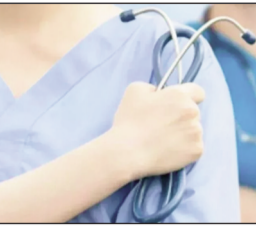
रेडियोग्राफर अटेंडेंट में भी नामांकन होगा। इस परीक्षा में वर्सुनिष्ठ प्रश्न पूछे जाएंगे। डिप्लोमा एवं सर्टिफिकेट पाठ्यक्रमों के लिए अलग-अलग परीक्षा दो पालियों में आयोजित होगी। इधर, कृषि एवं अन्य संबद्ध पाठ्यक्रमों में नामांकन के लिए झारखंड संयुक्त प्रवेश प्रतियोगिता परीक्षा 15 जून को रांची और दुमका के विभिन्न केंद्रों पर आयोजित होगी। यह परीक्षा पीसीबी, पीसीएम तथा पीसीएमबी ग्रुप के लिए अलग-अलग पालियों में होगी। जेसीईसीसीबी ने इस परीक्षा के प्रवेश पत्र डाउनलोड करने के लिए अपनी वेबसाइट पर लिंक जारी कर दिया है।

नवबिहार टाइम्स संवाददाता रांची। राज्य के सरकारी एवं गैर सरकारी फोर्मेसी तथा पैरामेडिकल संस्थानों में संचालित डिप्लोमा एवं सर्टिफिकेट पाठ्यक्रमों में नामांकन के लिए पैरामेडिकल प्रवेश परीक्षा अब 20 जुलाई को होगी। पहले यह परीक्षा 29 जून को ही निर्धारित थी। झारखंड संयुक्त प्रतियोगिता परीक्षा पर्व (जेसीईसीसीबी) ने अपरिहार्य कारणों से परीक्षा की तिथि में बदलाव किया है। साथ ही पर्वद ने ऑनलाइन आवेदन नवीकरण का समय सीमा 16 जून से बढ़ाकर पांच जुलाई कर दी है। इस प्रवेश परीक्षा के माध्यम से इंटर स्तरीय पाठ्यक्रमों फोर्मेसी तथा पैरामेडिकल में नामांकन होगा। इनमें फोर्मेसी पाठ्यक्रम दो वर्ष तीनों माह तथा पैरामेडिकल पाठ्यक्रम दो वर्ष का डिप्लोमा पाठ्यक्रम है। इस परीक्षा के माध्यम से मैट्रिक स्तरीय सर्टिफिकेट पाठ्यक्रमों जैसे ड्रेसर, मेडिकल लैब अटेंडेंट तथा