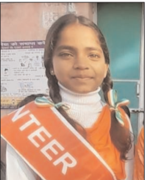
उपायुक्त ने बताया कि जिला प्रशासन द्वारा नुकड़ नाटक, शपथ ग्रहण, स्कूलों में जन-जागरूकता कार्यक्रम जैसे आयोजनों को प्राथमिकता देकर इस अभियान को जन-जन तक पहुंचाया जाएगा। अनुमंडल पदाधिकारी गिरिडीह ने कार्यशाला के दौरान कहा कि कोई भी सामाजिक बुरावला पहलें खुद से शुरू होता है। उन्होंने कहा कि नशामुक्ति के इस अभियान में युवाओं की भागीदारी सबसे अधिक होनी चाहिए। हम सभी को मिलकर अपने जिले, राज्य और देश को नशा मुक्त बनाने का दृढ़ संकल्प लेना होगा। कार्यक्रम के दौरान

गिरिडीह। जिले में निषिद्ध मादक पदार्थों के विरुद्ध जन-जागरूकता अभियान के तहत समाहरणालय सभागार में एक दिवसीय कार्यशाला का आयोजन किया गया। कार्यक्रम का उद्घाटन उपायुक्त राम निवास यादव सहित वरिष्ठ अधिकारियों द्वारा दीप प्रज्वलित कर किया गया। उपायुक्त यादव ने अपने संबोधन में कहा कि 10 जून से 26 जून तक चलने वाले राज्यव्यापी अभियान के अंतर्गत हम सभी का यह कर्तव्य बनता है कि हम अपने घर, समाज और कार्यस्थल पर नशा मुक्ति का संदेश फैलाएं। उन्होंने कहा कि नशा एक व्यक्ति को शारीरिक, मानसिक और आर्थिक रूप से तोड़ता है तथा समाज की नींव को दमक कर तोड़ता है। उन्होंने युवाओं से विशेष आग्रह किया कि वे अपनी उर्जा को रचनात्मक और राष्ट्र निर्माण के कार्यों में लगाएं, क्योंकि युवाओं की शक्ति देश की सबसे बड़ी पूंजी है। उन्होंने कहा कि आज किशोरों में भी नशे की प्रवृत्ति बढ़ रही है, जो गंभीर चिंता का विषय है। कार्यशाला के दौरान