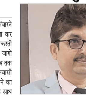
तब्दील हो चुकी है अभी भी वक्त है अगर इन बानुओं में ताकत है तो बचा लो अपनी अस्मिता का शिवालय अपनी शोहरत और स्वाभिमान को बना अभी 1700 लोगों को ही सरकार के तुलसीकी फरमान और हिटलरशाही का दंश झेलने को झाँकियां दिखाई जा रही है अगर एक प्लेटफॉर्म पर नहीं आए तो इस नापक इरादों वाली ताकतों की पूरी फ़िल्म भी देखनी पड़ सकती है। ये जेटेट का झूठा सपना दिखा कर पारा शिक्षकों को वेतनमान से दूर खरना इस अर्धवेदनीय विचारों वाली सरकार को महंगा पड़ सकता है 2013 ,2016 के बाद करीब दस सालों के बाद टेट परीक्षा का आयोजन करने का मुंगीर लाल का सपना नहीं देखा जा सकता है पारा शिक्षकों को फुट डलवा कर हम सभी की सांगठनिक ताकतों को भस्मासुर की तरह भस्म करने में अंजक रही है मित्रों से सादर निवेदन है कि नेता बनने की कोशिश मत कर कार्यकर्ता बन कर देश और समाज को सेवा करो पारा शिक्षकों को मदद करो।

गिरिडीह। झारखंड में पारा शिक्षकों का भाग्य संवारेने में सरकार सहायक अध्यापकों की ताज पहना कर उन्हें बेहतर सुविधा देने की शोथी दलील पेश करती रही है स्वामी विवेकानंद जी ने कहा था उठो जागो और अपने हक के लिए तलक संघर्ष करो जब तक लक्ष्य की प्राप्ति नहीं हो जाती झारखंड के मूलवासी पारा शिक्षकों को सभी सरकारों ने हमेशा छलने का ही काम किया है जिस उमीद और विश्वास के साथ राज्य के 62 हजार सहायक अध्यापकों ने हेमंत सोरेन की नेतृत्व वाली महागठबंधन की अबुआ सरकार को सता का ताज पहना कर अपने भाग्य संवारेने का सपना देखा था आज उस उमीद और आकांक्षाओं पर पानी फिर चुका है फुट डालो शासन करो की नीतियां अपनाकर गरीब पारा शिक्षकों को गुलामी के तहखानों में आर्थिक शोषण और संवैधानिक अधिकार का दमन किया जा रहा है समान काम का समान वेतन के परखच्चे उड़ रहे हैं समानता का अधिकार कुचला जा रहा है। मित्रों टेट, अग्रशिक्षित, सहायक आचार्य जैसे अनेक टुकड़ों में विभाजित कर राज्य के सबसे बड़ा संगठन पारा शिक्षकों के वजूद को ध्वस्त करने में वर्तमान सरकार का पूरा हाथ है लाखों इंचों बनेते हैं बनकर बिखर जाते हैं जीवन भर ठोकर खाती खामें जो पारा शिक्षक कहलाते हैं बिछरा हुआ समाज और बिछरी हुई ताकत कभी भी कल्याणकारी साम्राज्य स्थापित नहीं हो सकती हैं। झारखंड सरकार और उनकी तानाशाह ब्यूरोक्रेसी की इस कुव्यवस्था से पारा शिक्षकों के हौंसलों पर पानी फिरता नजर आ रहा है और अब पारा शिक्षकों की जिन्दगी मरुस्थल में