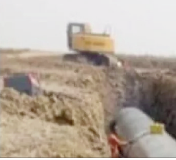
देवघर और जामताड़ा को लाभ मिलेगा। सारट के साथ साथ करौं, जामताड़ा और विद्यासागर प्रखंड के उपरी इलाके के खेतों में पाइप लाइन से सिंचाई होगी। देवघर का यह सिंचाई योजना झारखंड में गढ़वा के बाद दूसरा है। जिसमें 190 गांव के सभी तालाब और डोबा को इस लिफ्ट इरिगेशन से हमेशा लबालब रखा जाएगा। गर्मी के दिनों में तालाब सूख भी जाय तो किसानों को चिंता नहीं करनी होगी। तालाब तक जाने के लिए अलग से पाइप लाइन का प्रविधान किया गया है। धान, गेहूँ, मक्का की तो खेती होगी, नकदी सब्जी भी किसान करेंगे। किसानों की आमद बढ़ेगी। खाद्यान्न के संकट को यह योजना दूर करने में मददगार होगी। अजय बाराज पर बनाने के पीछे मकसद यह कि यहां से पानी लिफ्ट कर पंप हाउस लाया जाएगा। तीन पानी टंकी में इसका भंडारण कर पाइप लाइन से खेतों तक अजय बाराज से पानी जाएगा। 27 पंचायत के 13,164 हेक्टेयर में चक्रवार जाएगा पानी। धान, गेहूँ, सरसों, मक्का, मूंग के साथ नकदी सब्जियां बढेगी। सोलर पावर प्लांट से होगा योजना का संचालन, बिजली बिल का झंझट दूर। पाइप लाइन से देवघर और

नवबिहार टाइम्स संवाददाता देवघर। सिकटिया मेगा लिफ्ट सिंचाई योजना की राह में वन भूमि के एनओसी का अड़चन दूर कर लिया गया है। एक महीने में एनओसी क्लीयर हो जाएगा। कार्य की रफ्तार और विभागीय दावे कहे रहे हैं कि इस साल दिसंबर में योजना पूरी हो जाएगी और 13,164 हेक्टेयर जमीन सिंचित होगा। नोनियाटांड गांव में मुख्य पॉपिंग स्टेशन पूरा होने के कगार पर है। पाइप लाइन बिछाया जा रहा है। इस कारण एक खुशखबरी यह कि सितंबर में आंशिक रूप से चालू होकर दो हजार हेक्टेयर जमीन को सिंचित करने लगेगा। इस योजना की सबसे बड़ी खासियत यह कि नदी तल से उपर खेती योग्य जमीन को पारंपरिक कहर प्रणाली के कारण धान का कटोरा कहा जाने वाला सारट के खेत को पानी मिलने लगेगा। मेगा लिफ्ट योजना से दो जिला