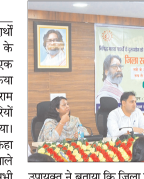
समेत कई अन्य अधिकारी और कर्मचारी उपस्थित रहे।

विश्व बाल श्रम निषेध दिवस के अवसर पर पॅसिल पोटेल की जानकारी भी दी गई, जिसके माध्यम से कोई भी व्यक्ति बाल श्रम से संबंधित घटनाओं की गोपनीय रूप से सूचना दे सकता है। मास्टर ट्रेनर्स द्वारा नशा मुक्ति से जुड़ी विशेष प्रशिक्षण सत्र आयोजित की गई और सरकार के इस आंदोलन को जन-जन तक पहुंचाने का संदेश दिया गया। कार्यक्रम में जिला अनुमंडल पदाधिकारी खोरिगहुआ, पुलिस उपाधीक्षक, जिला समाज कल्याण पदाधिकारी, खाद्य सुरक्षा पदाधिकारी