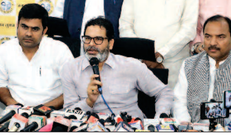
बाद इसबार नीतीश कुमार को हटा कर अपना मुख्यमंत्री बनाएंगे।उन्होंने स्पष्ट शब्दों में कहा कि नीतीश कुमार किसी स्थिति में बिहार के अगले मुख्यमंत्री नहीं बनेंगे, उनके दल को इतनी कम सीटें आरंभी कि उनके किसी तरफ पलटने का फायदा नहीं होगा। कहा नीतीश कुमार में इतना दम नहीं है कि फलटी मार लें, वह चुनाव जीतने के बाद फलटी मारेंगे। वह मुख्यमंत्री नहीं बने वाले हैं। बिहार सरकार द्वारा पेश किए गए बजट पर प्रशांत किशोर का हमला, बोले - इस

बेतिया/नवबिहार टाइम्स ब्यूरो। जन सुराज पार्टी के संस्थापक प्रशांत किशोर ने कहा है कि लालू प्रसाद एवं नीतीश कुमार ने पिछले 35 वर्षों में बिहार को बर्बाद कर दिया है और इस बर्बादी के लिए कांग्रेस और भाजपा समान रूप से गुनाहगार है। लौरीया में आयोजित जन सुराज उदघोष यात्रा के दौरान बेतिया पहुंचे पीके ने पत्रकारों को संबोधित करते उक्त बातें कही। उन्होंने कहा कि प्रधानमंत्री मोदी जी बिहार आने पर नीतीश जी को बिहार का लाडला मुख्यमंत्री रहेंगे। यह मोदी जी से अपील करता हूँ, अगली बार बिहार आए तो उन्हें यह घोषणा करने चाहिए कि यही लाडले व्यक्ति अगले 5 वर्ष भी मुख्यमंत्री रहेंगे। यह घोषणा करने पर भाजपा को चम्पारण में एक एक सीट पर हार का सामना करना पड़ेगा। भाजपाई नीतीश कुमार को खाली मुखौटा बना कर वोट लेना चाहते हैं, चुनाव जीतने के