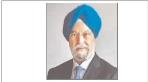
हरदीप एस पुरी

लोकतंत्रों से अपेक्षा की जाती है कि वे वंचितों और अल्पवंचितों तक सेवाओं और सुविधाओं की पहुंच सुनिश्चित करने में उच्च मानकों पर खरे उतरें। भारत में यह कसौटी और भी कठोर है। कोई भी नारा बिना उद्देश्य के और कोई भी दावा बिना परिणाम के नहीं टिकता। वास्तविक बदलाव का फायदा समाज के अंतिम छोर पर खड़े व्यक्ति तक पहुंचना चाहिए, क्योंकि हमारे लोकतंत्र में, अंत्योदय (समाज के अंतिम व्यक्ति के उत्थान) के लिए वोट किया जाता है। यही कारण है कि मोदी 3.0 के एक वर्ष में, दिल्ली, महाराष्ट्र और हरियाणा में मिले शानदार जनता केवल राजनीतिक उपलब्धि नहीं हैं, बल्कि वे इस बात की पुष्टि करते हैं कि आज के भारत में, बयानबाजी नहीं, बल्कि काम करके भरोसा जीता जाता है।