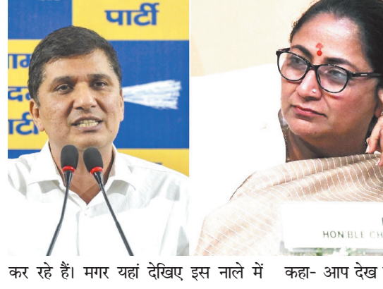
कह- आप देख सकते हैं कि सिल्ट लगभग