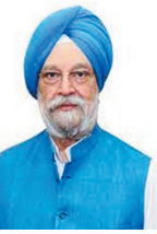
हरदीप एस. पुरी

भारत कुछ दिन पहले ही जापान को पीछे छोड़कर दुनिया की चौथी सबसे बड़ी अर्थव्यवस्था बन गया है। वर्ष 2014 से, प्रधानमंत्री मोदी के नेतृत्व में, भारत की जीडीपी 2025 में दोगुनी से अधिक बढ़कर 4.3 ट्रिलियन अमेरिकी डॉलर हो चुकी है। यह सुधारों, उदारपूर्ण नीति और आत्मनिर्भरता की निरंतर खोज पर केंद्रित एक दशक लंबी रणनीति का परिणाम है।