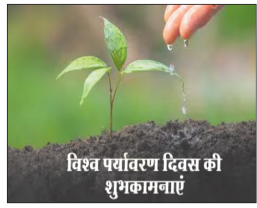
विश्व पर्यावरण दिवस की शुभकामनाएं