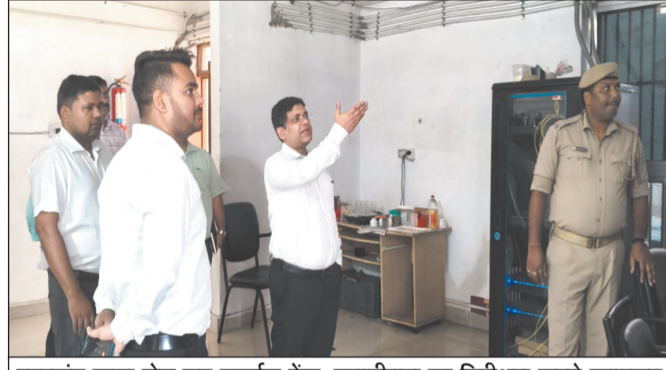
झारखंड खुला जेल सह पुनर्वास केंद्र, हजारीबाग का निरीक्षण करते उपायुक्त