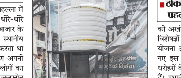
कुएं के ठीक उपर बनी टंकी

औरंगाबाद। शहर के न्यू काजी मोहल्ला में स्थित एक ऐतिहासिक कुआं अब धीरे-धीरे विलय की ओर बढ़ रहा है। मुख्य बाजार के समीप स्थित यह कुआं, जहां कभी स्थानीय समुदाय के जीवन का केंद्र हुआ करता था अब उपेक्षा और अनदेखी के कारण अपनी पहचान खोता जा रहा है। स्थानीय लोगों का कहना है कि यह कुआं न केवल जलस्रोत के रूप में महत्वपूर्ण रहा है, बल्कि यह मोहल्ले की सांस्कृतिक और ऐतिहासिक विरासत का भी हिस्सा रहा है। इसके बावजूद बीते कुछ वर्षों में इस धरोहर के संरक्षण को लेकर न तो कोई टोस प्रयास किए गए हैं और न ही किसी प्रकार की देख-रेख सुनिश्चित की गई है। स्थिति और भी चिंताजनक तब हो गई जब कुएं के ऊपर