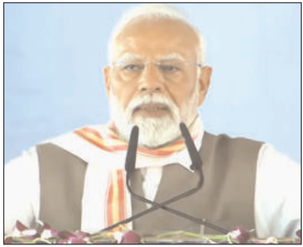
एक्सप्रेस-वे, बक्सर-भरौली गंगा नदी पर पुल और

विक्रमगंज (रोहतास)। भारत के प्रधानमंत्री नरेंद्र मोदी ने बिहार दौर के दौरान शुक्रवार को विक्रमगंज में 48,520 करोड़ की योजनाओं का शिलान्यास और उद्घाटन किया। इनमें सासाराम से पटना तक नई फोरलेन सड़क, औरंगाबाद (नबीनगर) में 2400 मेगावाट की ऊर्जा परियोजना, पटना-गया-डोभी फोरलेन सड़क परियोजना, गोपालगंज रिंग रोड, सासाराम और अनुग्रह नारायण रेलवे स्टेशन पर स्वचालित सिद्धियां, सोननगर-मोहम्मदगंज तीसरी रेलवे लाइन, जहानाबाद नवोदय विद्यालय में डोरमेट्री और स्टाफ क्वार्टर, आरा-सासाराम फोरलेन मार्ग, वाराणसी-रांची-कोलकाता