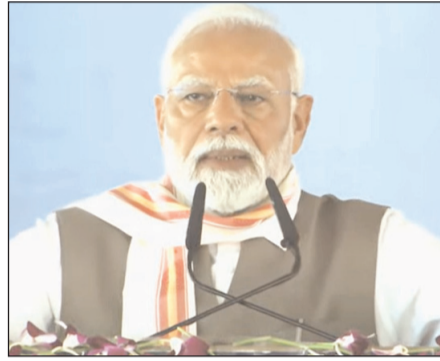
रामनगर-कच्ची दरगाह सिक्स लेन सड़क आदि परियोजनाएं शामिल हैं। इसके बाद प्रधानमंत्री नरेंद्र मोदी

विक्रमगंज(रोहतास)। भारत के प्रधानमंत्री नरेंद्र मोदी ने बिहार दौरे के दौरान शुक्रवार को विक्रमगंज में 48,520 करोड़ की योजनाओं का शिलान्यास और उद्घाटन किया। इनमें सासाराम से पटना तक नई फोरलेन सड़क, औरंगाबाद (नबीनगर) में 2400 मेगावाट की ऊर्जा परियोजना, पटना-गया-डोभी फोरलेन सड़क परियोजना, गोपालगंज रिंग रोड, सासाराम और अनुग्रह नारायण रेलवे स्टेशन पर स्वचालित सिद्धियां, सोननगर-मोहम्मदगंज तीसरी रेलवे लाइन, जहानाबाद नवोदय विद्यालय में डोरमेट्री और स्टाफ क्वार्टर, आरा-सासाराम फोरलेन मार्ग, वाराणसी-रांची-कोलकाता एक्सप्रेस-वे, बक्सर-भरौली गंगा नदी पर पुल और