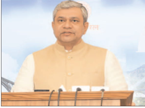
नेतृत्व 3,229.97 करोड़ रही। इस कंपनी के नवरत्न बनने का यह

रेलवे के बदलाव का एक बड़ा उदाहरण है। उन्होंने वित्त मंत्री का भी इस मौके पर धन्यवाद किया। 2014 के बाद से रेलवे की सभी सूचीबद्ध सार्वजनिक कंपनियों को नवरत्न का दर्जा मिल चुका है। आईआरसीटीसी जो कि रेलवे मंत्रालय के अधीन एक केंद्रीय सार्वजनिक उपक्रम है, ने वित्तीय वर्ष 2023-24 में 4,270.18 करोड़ का कारोबार और 1,111.26 करोड़ का शुद्ध लाभ दर्ज किया है। इस दौरान इसकी कुल