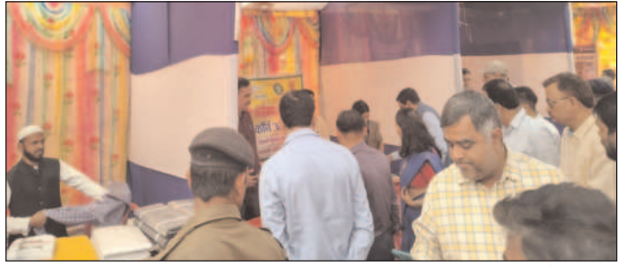
का उद्देश्य स्थानीय खादी उद्योग को प्रोत्साहित करना, ग्रामीण कारीगरों को एक बड़ा मंच देना और लोगों को खादी अपनाने के लिए प्रेरित करना है। उन्होंने कहा 'खादी सिर्फ एक कपड़ा नहीं, बल्कि स्वदेशी आत्मनिर्भरता और पर्यावरण संरक्षण का प्रतीक है।' वहीं मेला आयोजकों ने बताया कि दो दिवसीय इस आयोजन में बड़ी संख्या में किसान, उद्यमी, विद्यार्थी और आम नागरिक भाग ले रहे हैं। मेले में मिट्टी सुधार, जैविक खेती, कृषि यंत्रीकरण, पशुपालन और सहकारिता से जुड़े

पटना/भागलपुर। कृषि मेला सह किसान सम्मान में इस बार बिहार राज्य खादी एवं ग्रामोद्योग बोर्ड द्वारा लगाए गए खादी उत्पादों के विशेष स्टॉल दर्शकों और खरीदारों के लिए आकर्षण का केंद्र बने हुए हैं। यह मेला 3 और 4 मार्च को कृषि भवन परिसर, तिलकामांझी, भागलपुर में आयोजित किया जा रहा है जहां खादी के परंपरागत और आधुनिक परिधानों के साथ-साथ हस्तशिल्प उत्पादों की भी प्रदर्शनी की गई है। खादी स्टॉल पर खादी वस्त्र, सिल्क एवं कॉटन साड़ियों, जैविक रंगों से बने कपड़े, पुरुषों के लिए कुर्ते-पायजामे, जैकेट और अन्य परंपरिक परिधान सहित विभिन्न आत्मनिर्भरता और पर्यावरण संरक्षण का प्रतीक है। स्थानीय कारीगरों द्वारा तैयार किए गए खादी बैग, होम डेकोर उत्पाद, हस्तनिर्मित साबुन, हर्बल उत्पाद और अन्य ग्रामोद्योग सामग्री भी स्टॉल पर प्रदर्शित की गई हैं। बिहार राज्य खादी एवं ग्रामोद्योग बोर्ड की मीडिया प्रतिनिधि ने बताया कि इस पहल