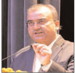
सरकार सबसे ज्यादा 60 हजार करोड़ से ज्यादा शिक्षा पर खर्च करेगी। उन्होंने कहा कि बजट में 52 नई घोषणाएं की गई हैं। इसमें महिलाओं के लिए कई बड़ी घोषणा की गई हैं जिनमें स्टेट रोड ट्रांसपोर्ट कॉर्पोरेशन में महिलाओं को नौकरियों में 33 प्रतिशत आरक्षण दिया जाएगा। महिलाओं के लिए पिक टॉयलेट बनाने, बड़े शहरों में पिक बस सर्विस शुरू करने जो

पटना। स्वास्थ्य मंत्री मंगल पाण्डेय ने बिहार बजट 2025-25 का स्वागत करते हुए कहा है कि यह बजट विकसित भारत 2047 की नींव को मजबूत करने के लिए प्रस्ताव का स्वागत करते हुए उन्होंने कहा है। स्वास्थ्य-प्रक्षेत्र व स्वास्थ्य सुविधाओं के विकास पर 20 हजार 335 करोड़ खर्च करने के प्रस्ताव का स्वागत करते हुए उन्होंने कहा है इससे आम लोगों व गरीबों को स्वास्थ्य-सुविधाएं सहज रूप से उपलब्ध होंगी। बेमुराया में कैंसर अस्पताल खोलने के घोषणा भी स्वागतयोग्य है। श्री पाण्डेय ने कहा है कि वित्त मंत्री सम्राट चौधरी ने विधानसभा में 3.17 लाख करोड़ रुपए का बिहार का बजट पेश किया है जो पिछले साल से 38 हजार करोड़ अधिक है। उन्होंने कहा कि