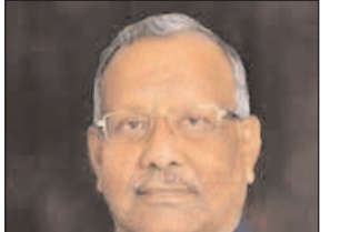
महिलाओं के लिए छात्रावास, गरीब बेटों की शादी के लिए सरकारी कन्या मंडप सहित खाद्य प्रसंकरण नीति के निर्माण, अहर, मूंग, उड़क आदि का न्यूनतम समर्थन मूल्य का निर्धारण करने, प्रखंड लेवल पर 'तरकारी सुधा' आउटलेट खोलने जाने, पिछड़े वर्ग, अनुसूचित जाति एवं जनजाति के लिए छात्रवृत्ति की राशि दोगुनी किए जाने इत्यादि कई महत्वपूर्ण प्रावधान 2025-26 के बजट में किए गए हैं।

पटना। पूर्व उप मुख्यमंत्री तारकिशोर प्रसाद ने बिहार बजट-2025 को प्रगतिशील बजट बताया है। उन्होंने कहा कि इस बजट से युवाओं, किसानों और महिलाओं की समृद्धि के द्वार खुलेंगे और विकसित बिहार के सपनों को नई एतार मिलेगी। उन्होंने कहा कि 2025-26 का बिहार बजट लगभग 3.17 लाख करोड़ का है जिसमें शिक्षा पर सबसे अधिक बजट का प्रावधान किया गया है। उन्होंने कहा कि बजट में स्वास्थ्य, ग्रामीण विकास और ऊर्जा के लिए भी बेहतर बजट प्रावधान सुनिश्चित किए गए हैं। कृषि बाजार समिति के आधुनिकीकरण, खेल संरचनाओं के निर्माण, प्रखंडों में आउटरीच स्टेशन, बेमुराया में कैंसर अस्पताल के निर्माण, महिलाओं के लिए इंडिया ट्रेनिंग सेंटर और पिक बस, प्रमुख शहरों में कामकाजी