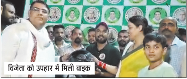
विजेता को उपहार में मिली बाइक