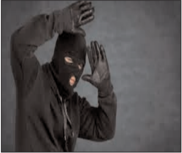
भीतर घुसे। उस वक्त घर की महिला सदस्य एक कमरे में सो रही थी। चोरों ने सबसे