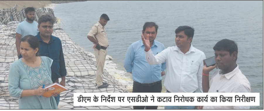
डीएम के निर्देश पर एसडीओ ने कटाव निरोधक कार्य का किया निरीक्षण