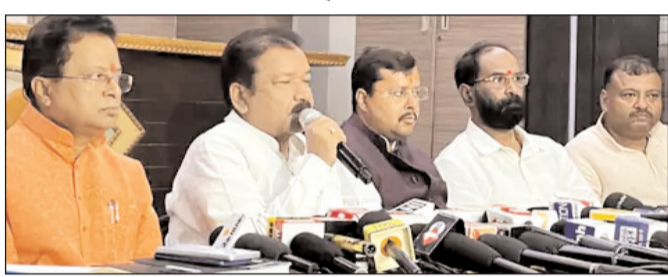
में आयोजित प्रेस वार्ता में प्रधानमंत्री नरेंद्र मोदी के बिहार दौरे की जानकारी देते हुए दिलीप जायसवाल ने कहा कि यह लगातार दौरा इस बात का संकेत है कि बिहार भाजपा और प्रधानमंत्री की

पटना। बिहार विधानसभा चुनाव को देखते हुए प्रधानमंत्री नरेंद्र मोदी का धुआंधार बिहार दौरा शुरू हो चुका है। पीएम मोदी इस चुनावी साल में पांचवीं बार 29 मई को दो दिवसीय दौरे पर बिहार आ रहे हैं। पीएम मोदी के इस दौरे से पहले ही उनका एक और बिहार दौरा तय हो गया है। प्रधानमंत्री जून में फिर बिहार आयेंगे। भाजपा के प्रदेश अध्यक्ष दिलीप जायसवाल ने मंगलवार को बताया कि पीएम मोदी एकबार फिर 20 जून को बिहार आयेंगे। भाजपा कार्यालय