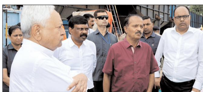
बिहार और पटना संग्रहालय के दर्शक आसानी से एक जगह से दूसरी जगह जाकर प्रदर्शों का अवलोकन कर सकें। उन्होंने कहा कि टनल का बेहतर ढंग से

पटना। मुख्यमंत्री नीतीश कुमार ने बिहार तथा पटना संग्रहालय को जोड़नेवाली निर्माणाधीन टनल का निरीक्षण किया तथा निर्माण कार्य बेहतर ढंग से जल्द पूर्ण करने का निर्देश दिया। मुख्यमंत्री ने बिहार संग्रहालय के पास टनल निर्माण कार्य की प्रगति की जानकारी ली। निरीक्षण के दौरान मुख्यमंत्री ने अधिकारियों को निर्देश दिया कि टनल निर्माण का कार्य जल्द पूर्ण करें, जिससे