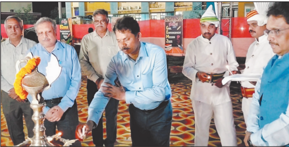
नवबिहार टाइम्स ब्यूरो

शिक्षा, कराटे, योग और कम्प्यूटर प्रशिक्षण के साथ होगा व्यक्तित्व विकास