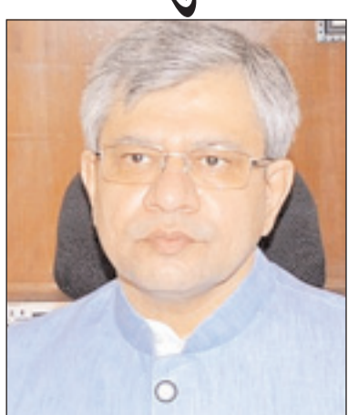
मशीनों, उत्पादन इकाइयों और कार्यशाला की स्थिति की समीक्षा करेंगे। इसके साथ ही अधिकारियों से वो उत्पादन क्षमता, संसाधनों के

पटना। केंद्रीय रेल मंत्री अश्विनी वैष्णव आज रात दो दिवसीय दौरे पर पटना पहुंचे। रेल मंत्री पटना, जमालपुर और मुंगेर में रेलवे से जुड़ी अहम प्रोजेक्ट्स और विकास कार्यों की समीक्षा करेंगे। रेल मंत्री का विमान आज रात पटना एयरपोर्ट पर उतरा जहां भाजपा के बड़े नेता और बिहार सरकार के अधिकारियों ने उनका स्वागत किया। श्री वैष्णव आज 23 मई की सुबह पटना से जमालपुर जंक्शन के लिए रवाना होंगे। वह ट्रेन से यात्रा करेंगे ताकि रास्ते में पड़ने वाले प्रमुख स्टेशनों की ग्राउंड रियलिटी चेक कर सकें। 23 मई को ही रेल मंत्री मुंगेर पहुंचेंगे, जहां वो मुंगेर रेल कोच फैक्ट्री का निरीक्षण करेंगे। यह कारखाना रेलवे की प्रोडक्शन यूनिट में से एक है, जहां यात्री डिब्बों के निर्माण और मरम्मत होता है। रेल मंत्री यहां