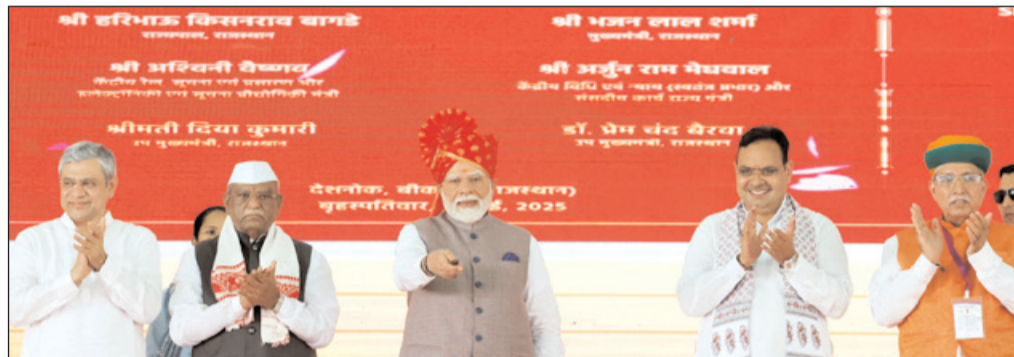
कि भारत अब पिछले वर्षों की तुलना में अधिक निवेश कर रहा है, एक ऐसी बुनियादी ढांचे के विकास में छह गुना प्रगति जिसे वैश्विक ध्यान आकर्षित किया है। उन्होंने देश भर में प्रतिष्ठित बुनियादी ढांचा परियोजनाओं की चर्चा

दिखाई। इस मौके पर पीएम मोदी ने कहा कि 11 साल में राजस्थान में करीब 70 हजार करोड़ खर्च किए गए हैं। केंद्र सरकार प्रदेश में रेलवे के विकास के लिए करीब 10 हजार करोड़ खर्च कर रही है। 2014 की तुलना में यह 15 गुना ज्यादा है। भारत के बुनियादी ढांचे में हो रहे बदलावों का उल्लेख करने के साथ आधुनिकीकरण के प्रति राष्ट्र की प्रतिबद्धता पर जोर देते हुए प्रधानमंत्री ने पिछले 11 वर्षों में सड़कों, हवाई अड्डों, रेलवे और रेलवे स्टेशनों में हुई तीव्र प्रगति की चर्चा की। उन्होंने कहा