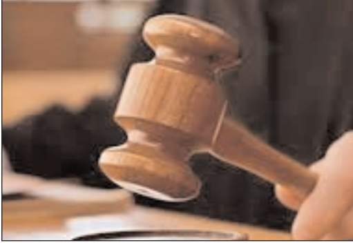
मोबाइल से 14,500 रुपये जबरन ट्रांसफर करवा लिए। हथियारबंद छह की संख्या में रहे