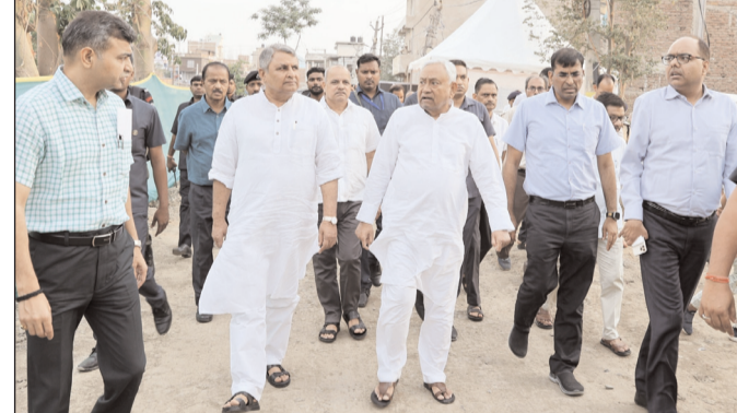
इसके ऊपर फोर लेन सड़क बनाने का कार्य तेजी से करें। उन्होंने कहा कि इसके निर्माण से सैदपुर, राजेन्द्र नगर, यह योजना काफी अच्छी है। उन्होंने अधिकारियों को निर्देश दिया कि सैदपुर नाले का बेहतर ढंग से जीर्णोद्धार कर