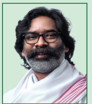
हेमन्त सोरेन मुख्यमंत्री, झारखण्ड