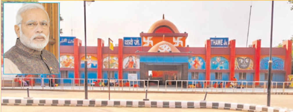
काकतीय साम्राज्य की वास्तुकला से प्रेरित है। बिहार में थावे स्टेशन में 52 शक्तिपीठों में से एक मां थावेवाली का प्रतिनिधित्व करने वाले विभिन्न भित्ति चित्र और कलाकृतियां शामिल हैं और मधुबनी पेंटिंग को भी दर्शाया गया है। गुजरात का डाकोर स्टेशन रणछोडराय जी महाराज से प्रेरित है। देश भर में पुनर्विकसित अमृत स्टेशनों में सांस्कृतिक विरासत के साथ आधुनिक बुनियादी ढांचे, दिव्यांगजनों के लिए यात्री केंद्रित सुविधाओं और यात्रा के अनुभव को बेहतर करने के लिए टिकाऊ प्रथाओं को एकीकृत किया गया है। भारतीय रेलवे अपने नेटवर्क के

रेल अवसंरचना को निरंतर बेहतर बनाने की अपनी प्रतिबद्धता के अनुरूप 18 राज्यों और केंद्र शासित प्रदेशों के 86 जिलों में 1100 करोड़ रुपये से अधिक की लागत से 103 पुनर्विकसित अमृत स्टेशनों का उद्घाटन करेंगे। अमृत भारत स्टेशन योजना के तहत 1300 से अधिक स्टेशनों को आधुनिक सुविधाओं के साथ पुनर्विकसित किया जा रहा है, जिन्हें क्षेत्रीय वास्तुकला को प्रतिबिंबित करने और यात्री सुविधाओं को बढ़ाने के लिए डिजाइन किया गया है। करणी माता मंदिर में आने वाले तीर्थयात्रियों और पर्यटकों की सेवा करने वाला देशनोक रेलवे स्टेशन मंदिर वास्तुकला, मेहराब और पलाना में एक सार्वजनिक समारोह को भी संबोधित करेंगे। प्रधानमंत्री देश में