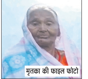
मृतका की फाइल फोटो

ग्रामीण बैंक के समीप सड़क पार करने के दौरान हुआ था हादसा