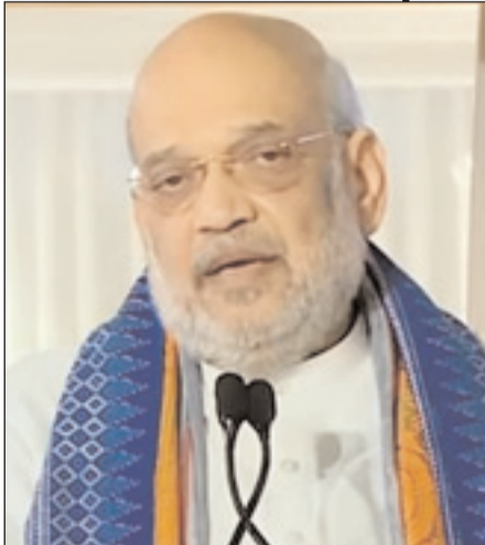
सहकारिता मंत्री ने कहा कि जब तक बदलाव का लाभ पैक्स और किसानों तक नहीं पहुंचेगा, तब तक सहकारिता क्षेत्र मजबूत नहीं हो सकता। श्री शाह ने अंतरराष्ट्रीय सहकारिता वर्ष के अवसर पर यहां 'विकसित भारत के निर्माण में सहकारिता की भूमिका' पर आयोजित सहकारी महासम्मेलन में कहा कि संयुक्त राष्ट्र ने 2025 को अंतरराष्ट्रीय सहकारिता वर्ष के तौर पर मनाने का निर्णय लिया है। सहकारिता शब्द पूरे विश्व में आज भी उतना ही प्रासंगिक है, जितना वर्ष 1900 में था। श्री शाह ने कहा कि प्रधानमंत्री नरेंद्र मोदी के नेतृत्व में भारत में 2021 से सहकारिता आंदोलन को पुनर्जीवित करने का एक बहुत बड़ा प्रयास हुआ। इसीलिए सहकारिता वर्ष की शुरुआत भारत में करने का निर्णय लिया गया। केंद्र सरकार ने 22 विभिन्न प्रकार के व्यवसायों को पैक्स से जोड़ने का काम किया गया है। मुझे यकीन है कि आने वाले समय में एक भी पंजीकृत पैक्स वित्तीय रूप से बीमार नहीं होगा। केंद्रीय मंत्री ने कहा कि डेयरी क्षेत्र में आइसक्रीम, चीज, पनीर बनाने, दूध को ठंडा रखने और वसा मापने जैसे उपकरणों के निर्माण के लिए सहकारी स्वामित्व वाली कंपनियों को बढ़ावा दिया जा रहा है। उन्होंने कहा कि सरकार डेयरी क्षेत्र में चक्रिय अर्थव्यवस्था को बढ़ावा देने की योजना बना रही है, जिसमें मरने वाले पशुओं की खाल, हड्डियों और सींगों के उपयोग के लिए सहकारी समिति का गठन किया जाएगा।

नयी दिल्ली। केंद्रीय सहकारिता मंत्री अमित शाह ने प्राथमिक कृषि ऋण समितियों को वित्तीय रूप से मजबूत बनाने पर जोर दिया है। उन्होंने रिवार को अहमदाबाद में अंतरराष्ट्रीय सहकारिता वर्ष के अवसर पर आयोजित 'सहकारी महासम्मेलन' में कहा कि केंद्र सरकार ने प्राथमिक कृषि ऋण समितियों (पैक्स) को वित्तीय रूप से मजबूत बनाने के लिए कई अहम कदम उठाये हैं। साथ ही उन्होंने कहा कि जल्द ही नए पैक्स के पंजीकरण के लिए नीति लाएगी। केंद्रीय सहकारिता मंत्री ने कहा कि हर पंचायत में पैक्स की स्थापना का है। इसके तहत दो लाख नई पैक्स और डेयरी शुरू की जाएंगी। साथ ही इन समितियों को 22 विभिन्न प्रकार के व्यवसायों से जोड़ा जा रहा है। इसके अलावा, यह बात भी सुनिश्चित की जाएगी कि पंजीकृत पैक्स वित्तीय रूप से कमजोर न हों। उन्होंने कहा कि सरकार जल्द ही आर्थिक संकट का सामना कर रही पैक्स के निपटारे और नई प्राथमिक कृषि ऋण समितियों के पंजीकरण के लिए जल्द ही एक नीति बनाएगी।