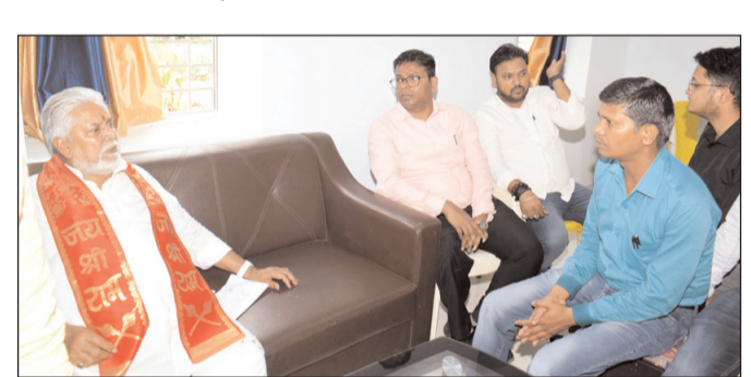
इनमें कॉमन सर्विस सेक्टर, प्रधानमंत्री जन औषधि केंद्र, पेट्रोल-डीजल रिटेल आउटलेट, प्रधानमंत्री किसान समृद्धि योजना चलाया जा रहा है। पैक्सों को मात्र खाद्यान्न अधिप्राप्ति का माध्यम बनाये रखने से सहकारी समितियों और सहकारिता विभाग की योजनाओं का

नवादा। नवादा के ककोलत जलप्रपात स्थित डाकबंगला में सहकारिता मंत्री डा. प्रेम कुमार ने विभागीय अधिकारियों के साथ समीक्षा बैठक की। इस क्रम में उन्होंने कहा कि सहकारी बैंकों में खाता खोलने के लिए ग्राम स्तर पर अभियान चलाएं। उन्होंने कहा कि सहकारी बैंक सहकारिता योजनाओं के क्रियाव्ययन में महत्वपूर्ण भूमिका निभाता है। इसलिए इन बैंकों को मजबूती प्रदान करना आवश्यक है। बैठक में उपस्थित सहकारिता प्रसार पदाधिकारियों को उन्होंने कहा कि विभाग द्वारा पैक्सों एवं सहकारी समितियों के सुदृढीकरण के लिए कई योजनाएं चलाई जा रही हैं। इन समितियों को बहुउद्देश्यीय बनाने के लिए