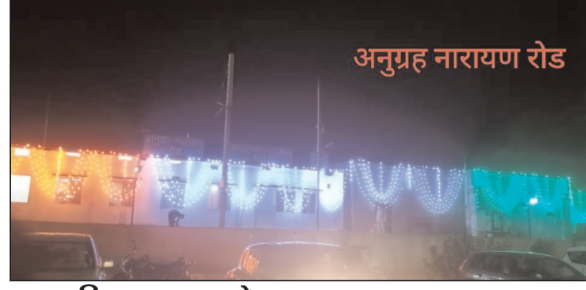
अनुग्रह नारायण रोड