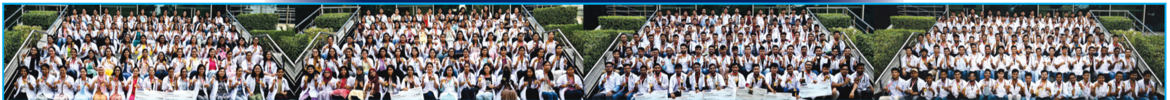
Some of the Selected GOAL Students in NEET - 2024

GOAL - The result factory, जहाँ साधारण छात्र भी पाते हैं असाधारण सफलता