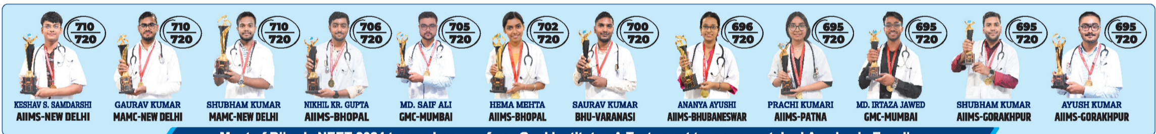
Most of Bihar's NEET 2024 top rankers are from Goal Institute - A Testament to our unmatched Academic Excellence

Not every warrior fights at the border; some wear white coats and fight to save lives.