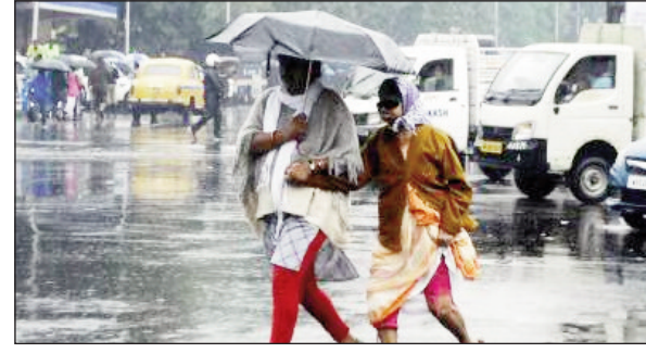
से लोगों को राहत मिलेगी। जिला में रोहिंगी नक्षत्र 25 मई से शुरू होकर दो जून तक रहेगी। किसान यदि इस बीच खेत को जोतकर धान का बिचड़ा गिरा देते हैं तो समय से भरपूर पानी मिल जाएगा और पौधा को बढ़ने में मदद मिलेगी। कृषि विभाग ने बीज विनिमय वितरण योजना के तहत 5000 किंवदल धान का बीज व सौ किंवदल उरद के बीज की मांग की है। डिमांड की स्वीकृति मिलने के साथ जिला से डीडी लगना चालू हो जाएगा और किसान को 50 प्रतिशत अनुदान

नवबिहार टाइम्स संवाददाता साहिबगंज। जून के पहले सप्ताह में इस बार साहिबगंज में मानसून पहुंच जाने की उम्मीद है। केरल के तट पर यह 27 मई तक ही पहुंच जाएगा। वहां से यहाँ तक मानसून के पहुंचने में 10-12 दिन लग सकता है। विगत कुछ साल से एक जून के आसपास केरल के तट पर मानसून पहुंचता था। इस बार इसके चार दिन पहले पहुंचने की उम्मीद है। अगर ऐसा हुआ तो करीब 10 साल बाद इस साल समय पर मानसून पड़ता है। झारखंड में पाकुड़ व साहिबगंज के रास्ते ही मानसून प्रवेश करता है। ऐसे में आठ-नौ जून के बाद राज्य के अन्य जिलों में भी मानसून का असर दिखने लगेंगे। मौसम विभाग (आईएमडी) के अनुसार, इस बार सामान्य से ज्यादा बारिश होने की उम्मीद है। ऐसे में गर्मी