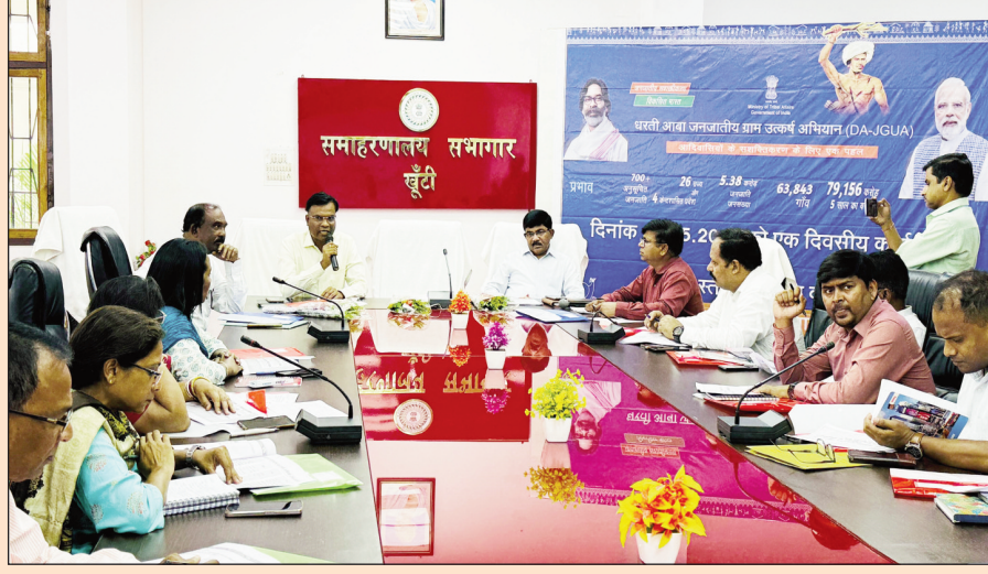
आवासीय विद्यालयों और आवासीय स्कूलों, सरकारी आवासीय विद्यालयों के बुनियादी ढांचे में सुधार करना उक्त अभियान का उद्देश्य है।

योजनाएं समाहित हैं। उन्होंने उक्त योजना के सफल संचालन व लक्ष्य की प्राप्ति हेतु कार्य योजना तैयार कर सभी विभागों के पदाधिकारियों से आपसी समन्वय के साथ कार्य करने का निर्देश दिया। उन्होंने कहा कि इस अभियान के तहत सभी जनजातीय परिवारों के जीवन स्तर में सुधार लाने के लिए कौशल विकास, उच्चमिता संवर्धन और स्वरोजगार के अवसर उपलब्ध कराया जाना है। सभी पात्र जनजातीय परिवारों को पक्का घर उपलब्ध कराया जाएगा। और उनके गांवों में सड़क, पानी, बिजली जैसी बुनियादी सेवाओं का विस्तार किया जायेगा। अधिक से अधिक मोबाइल मेडिकल यूनिट्स की सेवा ली जाएगी ताकि स्वास्थ्य सेवाओं की बेहतर पहुंच सुनिश्चित की जा सके। उन्होंने कहा कि सरकारी