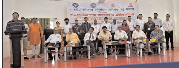
बिहारशरीफ के सहयोग से किया गया। जिस सेमिनार का विषय था भारत बोध: एक परिचय।