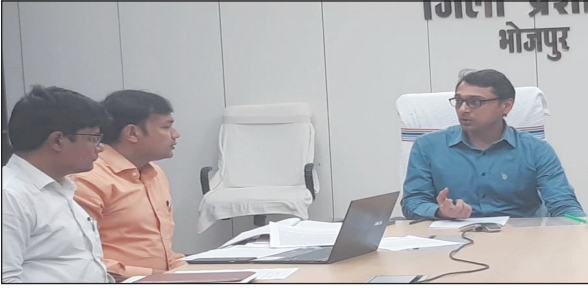
कार्य कर एक सप्ताह के अंदर निष्पादन सुनिश्चित करने का निर्देश दिए। बैठक में प्रभारी पदाधिकारी, राजस्व शाखा, सभी भूमि सुधार उप समाहर्ता, सभी अंचलाधिकारी एवं अन्य संबंधित अधिकारी मौजूद थे।

आरा। जिलाधिकारी तनय सुल्तानिया ने राजस्व विभाग से संबंधित दाखिल-खारिज, परिमार्जन और आधार सीडिंग की प्रगति की समीक्षा मंगलवार को की। इस दौरान उन्होंने सभी अंचलाधिकारियों को 75 और 35 दिनों से लंबित दाखिल-खारिज के मामलों का अविलंब निष्पादन सुनिश्चित करने का निर्देश दिए। अभियान 'बसेरा 2' के तहत उन्होंने सभी अंचलों में विशेष कैंप के माध्यम से पात्र लाभुकों को ससमय वास योग्य भूमि प्रदान करने का निर्देश दिए। इसके अलावा उन्होंने सभी भूमि सुधार उप समाहर्ताओं एवं अपर समाहर्ता को इस कार्य का सतत अनुश्रवण सुनिश्चित करने का आदेश दिया। परिमार्जन से जुड़े लंबित आवेदनों की विस्तृत समीक्षा करते हुए उन्होंने संबंधित अंचलाधिकारियों को कैंप मोड में