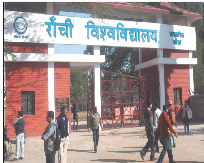
अधिक नहीं होनी चाहिए।