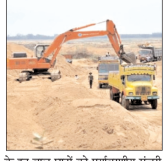
के इन बालू घाटों को पर्यावरणीय मंजूरी मिल चुकी है। पटना जिले की सर्वेक्षण रिपोर्ट में भी इन बालू घाटों की नीलामी का जिक्र किया गया है। रिपोर्ट के आधार पर इन नदियों के बालू घाटों को पांच एकड़ तक के छोटे टुकड़ों में बांटा गया है। इसमें सोन और गंगा नदियों के बालू घाट प्रमुखता से शामिल हैं। पुनपुन और दरधा नदियों के कुछ बालू घाटों की नीलामी पहले भी की गई थी। नीलामी प्रक्रिया में सफल होने वाले बंदोबस्तधारी नवंबर 2025 से बालू खनन प्रारंभ कर सकेंगे।

नवबिहार टाइम्स ब्यूरो। पटना। खान एवं भू-तत्व विभाग ने पटना जिले में गंगा नदी के साथ ही पुनपुन, सोन और दरधा नदियों के बालू घाटों की ई-नीलामी की प्रक्रिया शुरू करने का निर्णय लिया है। संबंधित नदी घाटों की नीलामी पांच वर्ष के लिए होगी। फिलहाल विभाग की योजना 148 घाटों की नीलामी की है। खान एवं भू-तत्व विभाग से मिली जानकारी के अनुसार इस नीलामी में पीला और सफेद दोनों किस्म का बालू शामिल है। इस पूरी प्रक्रिया का मकसद पटना जिले में निर्माण कार्यों के लिए आसानी से और उचित कीमत पर बालू की उपलब्धता सुनिश्चित करना है। सरकार के इस निर्णय से राजस्व में वृद्धि भी होगी। ई-नीलामी के लिए निविदा दस्तावेज 15 मई को सुबह 11 बजे से ऑनलाइन डाउनलोड किए जा सकेंगे। निविदा प्रक्रिया 12 जून अथवा रविवार तक संपन्न होगी। विभाग के सूत्रों ने बताया कि जिले में मौजूद चारों नदियों किनारे