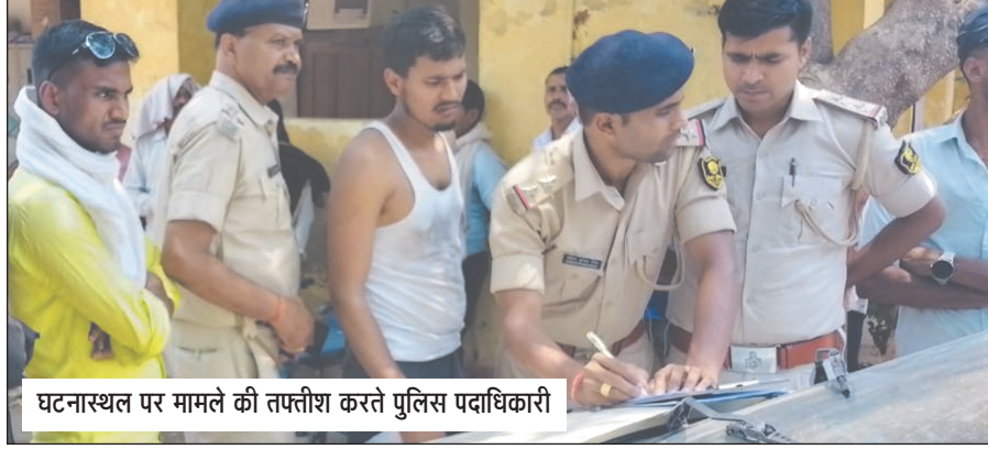
घटनास्थल पर मामले की तपतीश करते पुलिस पदाधिकारी