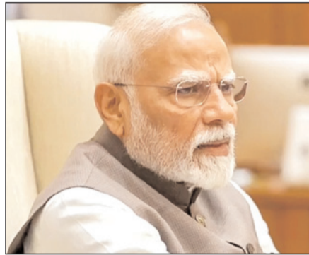
नरेन्द्र मोदी ने स्पष्ट निर्देश दिए हैं। पीएम ने कहा है कि अगर पाकिस्तान की ओर से गोली चलती है, तो यहां से गोलों से हमले होंगे। उन्होंने पहलगायाम हमले के बाद आतंकियों के खतमे के लिए शुरू किए ऑपरेशन सिंदूर को लेकर यह भी कहा है कि बीते कुछ दिनों में आतंकी

नवबिहार टाइम्स ब्यूरो। नयी दिल्ली। भारतीय सेना द्वारा सीमा पर पाकिस्तान की कारगराण हरकतों का मुंहतोड़ जवाब देने के बाद भारत के प्रधानमंत्री नरेन्द्र मोदी ने पाकिस्तान को स्पष्ट शब्दों में चेतावनी दे दी है। प्रधानमंत्री नरेन्द्र मोदी ने पाकिस्तान को खुली चेतावनी देते हुए कहा है कि अगर सीमा पार से गोली चलेगी तो भारत गोलों से उनका जवाब देगा। सूत्रों के मुताबिक रविवार को पीएम मोदी ने कहा कि वहां से गोली चलेगी तो यहां से गोला चलेगा। वहीं पीएम मोदी ने दोनों देशों के बीच मध्यस्थता का दावा करने वाले अमेरिका को भी समझा दिया है। पीएम मोदी ने कहा है कि अगर पाकिस्तान की तरफ से कोई भी हमला किया जाता है तो इसका अंजाम ठीक नहीं होगा और पाकिस्तान को इसके परिणाम भुगतने होंगे। सरकार के सूत्रों के हवाले से बताया गया है कि ऑपरेशन सिंदूर को लेकर प्रधानमंत्री