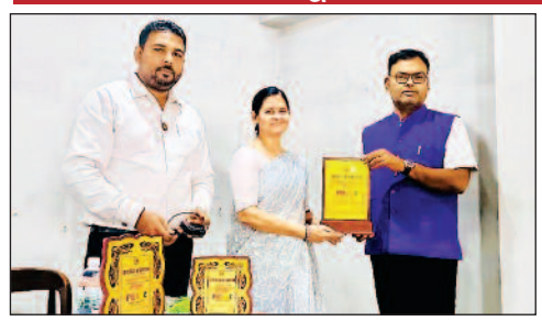
सशक्तिकरण को प्राथमिकता बताते हुए क्लब के सामाजिक