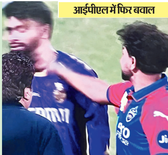
आईपीएल में फिर बवाल

सोशल मीडिया पर ये वीडियो वायरल हो रहा है, जिसमें तरह तरह के रिएक्शन आ रहे हैं। लोग हेयान हैं