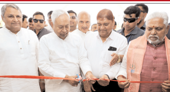
अतिथिगृह में पर्यटकों के ठहरने के लिए 120 कमरे बनाये गये हैं। देश-विदेश से आनेवाले पर्यटकों की आवश्यकताओं और उनकी सुविधाओं को ध्यान में रखते हुए इस अतिथिगृह का निर्माण कराया गया है। इस अतिथिगृह में पर्यटकों के लिए अंतर्राष्ट्रीय स्तर की सुविधाएं

गया। मुख्यमंत्री नीतीश कुमार ने आज बोधगया में महाबोधि अतिथिगृह का वेलकम होटल वाई आईटीसी के द्वारा संचालन का शिलापट्ट अनावरण कर एवं फीता काटकर शुभारंभ किया। शुभारंभ के पश्चात् मुख्यमंत्री ने अतिथि गृह का निरीक्षण किया। इस दौरान उन्होंने दूसरे और सातवें तल पर जाकर अतिथिगृह के कमरों एवं अन्य भागों का जायजा लिया और वहां की व्यवस्थाओं की जानकारी ली। आठ एकड़ में अंतर्राष्ट्रीय स्तर के बने