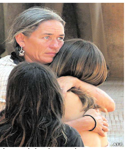
विदेशी दूतावास को भी भारतीय दूतावास से संपर्क में रहना चाहिए। उनकी सुरक्षा और सुविधाओं का ख्याल रखना हमारा दायित्व है। इस तरह की घटनाएं विदेशी पर्यटकों में असुरक्षा का जहाँ माहौल पैदा करती हैं वहीं हमारी सुरक्षा व्यवस्था पर भी सवाल उठती हैं। विदेशी पर्यटकों की सुरक्षा का अहम मामलों में सीधे केंद्रीय पर्यटन मंत्रालय का हस्तक्षेप होना चाहिए। पर्यटन अब ग्लोबल शौक बन चुका है। पर्यटन से दुनिया भर के देशों को एक अच्छी खासी आए हो

चाहिए। यह सरकारी एजेंसी के माध्यम से होनी चाहिए। भारत आने वाले ऐसे पर्यटक कहीं ठहर रहे हैं। कहां जा रहे हैं। उनके लिए कहां रुकना अच्छा रहेगा। सरकार की तरफ से उन्हें सारी सुविधा और सूचना उपलब्ध होनी चाहिए। सिविल पुलिस के बजाय इसके लिए अलग से विशेष पर्यटन पुलिस होनी चाहिए। पर्यटन पुलिस की विशेष जिम्मेदारी विदेशी सैलानियों की सुरक्षा के संदर्भ में होनी चाहिए। विदेशी पर्यटकों की सुरक्षा के लिहाज से सरकार को इस तरह की व्यवस्था के लिए आवश्यक कदम उठाने चाहिए। विदेशी पर्यटकों के साथ आमतौर पर भाषा की भी समस्या होती है ऐसे में उसके समाधान के लिए भी आवश्यक कदम उठाने चाहिए। दुमका में हुई घटना में भी पुलिस और पीडितों के बीच भाषा की समस्या देखने को मिली है। भारत आने वाली विदेशी पर्यटकों के लिए केंद्रीय पर्यटन मंत्रालय की तरफ से स्पष्ट गाइडलाइन भी होनी चाहिए। पर्यटकों को यह निर्देश होना चाहिए कि आप जहां जा रहे हैं वहां की भौगोलिक स्थिति क्या है। अगर आप पहाड़ी या आदिवासी इलाके में घूमने जा रहे हैं तो वहां क्या समस्या हो सकती है। पहाड़ और दूसरी जगह जा रहे हैं तो क्या-क्या सावधानी बरतनी चाहिए। स्थानीय लोगों के बारे में भी जानकारी देना आवश्यक है। उनकी सुरक्षा को लेकर जहाँ खतरा हो सकता है इस सम्बन्ध में उन्हें आगाह करने की भी आवश्यकता है।