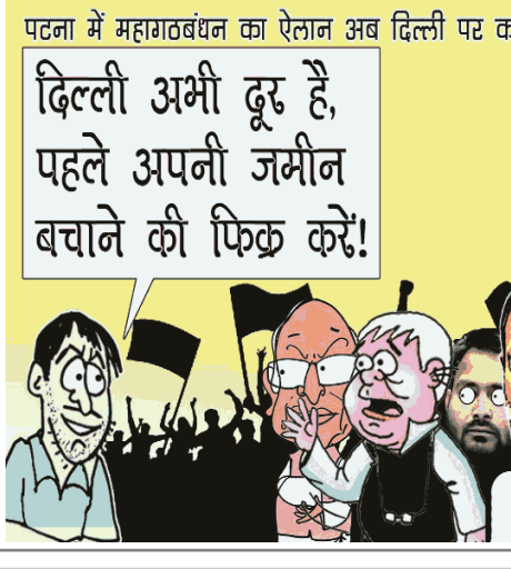
पटना में महागठबंधन का ऐतान अब दिल्ली पर कब्जा करो दिल्ली अभी दूर है, पहले अपनी जमीन बचाने की फिक्र करो!

अपने काम के प्रति उदासीनता के कारण परेशान हो सकते हैं। आज बहुत महत्वपूर्ण कार्यों से दूरी बनाकर रखनी चाहिये। दूसरों पर निर्भर नहीं रहना चाहिये।