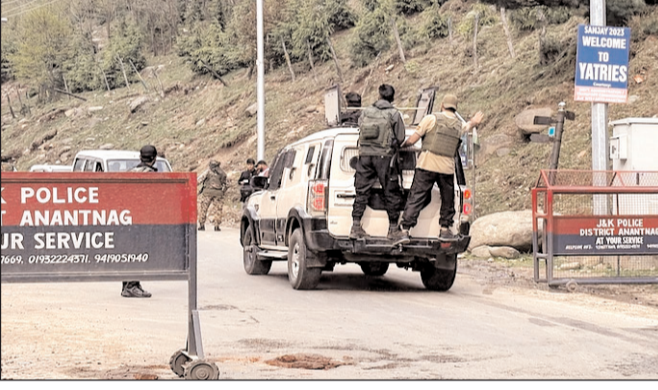
नौ एंबुलेंस से अस्पताल पहुंचाया गया है। बता दें कि हमला मंगलवार को अपराहन करीब तीन बजे हुआ, जब आतंकवादी बैसरन घाटी में पहाड़ से नीचे उतरे और वहां पर्यटकों पर गोलीबारी शुरू कर दी। इस स्थान को लंबे हरे-भरे घास के मैदानों के कारण

नवबिहार टाइम्स ब्यूरो श्रीनगर। दक्षिण कश्मीर के प्रमुख पर्यटक स्थल पहलगाम में मंगलवार को आतंकवादियों ने कार्रवाया करके की है। आतंकियों ने अंधाधुंध गोलीबारी की और 26 लोगों की जान ले ली। इस आतंकी हमले में कई लोग घायल भी बताए जा रहे हैं। हमले के तुरंत बाद सुरक्षाबलों ने इलाके की घेराबंदी कर घायलों को नजदीकी अस्पताल में भर्ती कराया। सेना, जम्मू-कश्मीर पुलिस और सीआरपीएफ ने आतंकियों की तलाश में सर्व ऑपरेशन शुरू कर दिया है। पहलगाम में आतंकी हमले से माहौल तनावपूर्ण हो गया है। सुरक्षाबलों की अतिरिक्त टुकड़ियां घटनास्थल पर पहुंच गई हैं। ऊंचाई वाला इलाका होने के कारण घायलों को छोड़े वालों की मदद से सड़क तक लाया गया, जहां से उन्हें