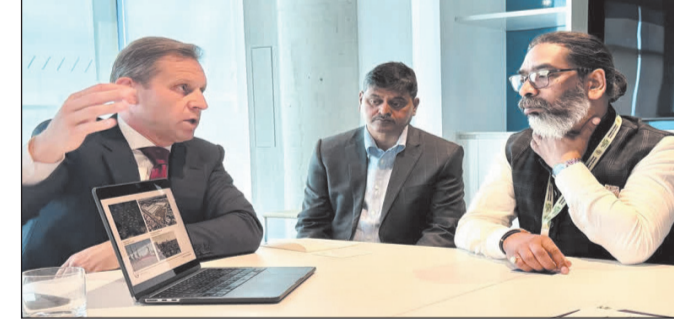
जानकारी के अनुसार इस यात्रा के क्रम में स्टार्टअप मेंटरशिप, क्लीन एनर्जी, पर्यावरणीय स्थिरता, सप्लाई चेन, बायो-फार्मास्यूटिकल्स, खेल विपणन, क्रिकेट टीम ओनरशिप, डीप-टेक बी2बी मार्केटिंग, लीगल, डेटिस्ट्री और मेडटेक जैसे विभिन्न क्षेत्रों पर चर्चा हुई है। प्रतिनिधिमंडल ने उद्यमिता, नवाचार और स्टार्टअप को बढ़ावा देने के लिए सुझाव दिए और झारखंड में एक जीवंत स्टार्टअप इकोसिस्टम के निर्माण में सहयोग देने की इच्छा जताई है। जानी-

नवबिहार टाइम्स ब्यूरो रांची। विदेशी निवेशकों को आकर्षित करने के लिए इन दिनों मुख्यमंत्री हेमंत सोरेन के नेतृत्व में राज्य सरकार का उच्चस्तरीय प्रतिनिधिमंडल स्वीडन और स्पेन दौर पर है। इस क्रम में राज्य सरकार की नीतियों से प्रभावित होकर कई क्षेत्रों में विदेशी निवेश के प्रस्ताव मिल रहे हैं। बार्सिलोना में आयोजित बैठक के दौरान राज्य सरकार को एक फुटबॉल क्लब ने यहां के खेल के विकास, विशेषकर फुटबॉल कोचों के प्रशिक्षण हेतु समझौता ज्ञापन पर हस्ताक्षर करने का प्रस्ताव दिया है। यह सहयोग बार्सिलोना के उत्कृष्ट खेल इकोसिस्टम, झारखंड में खेल खास कर फुटबॉल के विकास को बढ़ावा देगा। सूचना एवं जनसंपर्क विभाग द्वारा दी गई