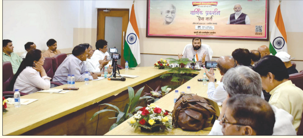
कारिगरो की अथक मेहनत को दिया है। अध्यक्ष केवीआईसी ने बताया कि वित्त वर्ष 2013-14 में खादी और ग्रामोद्योग उत्पादों का उत्पादन जहां 26109 करोड़ रुपये था, वहीं वित्त वर्ष 2024-25 में यह करीब चार गुना बढ़कर 347 प्रतिशत के उछाल के साथ 116599 करोड़ रुपये पहुंच गया जबकि वित्त वर्ष 2013-14 में बिक्री