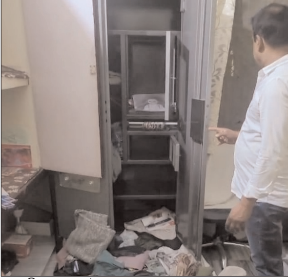
बिहार टाइम्स संवाददाता

फुलवारी थाना से कुछ ही दूरी पर चोरों ने दिखाई हिम्मत